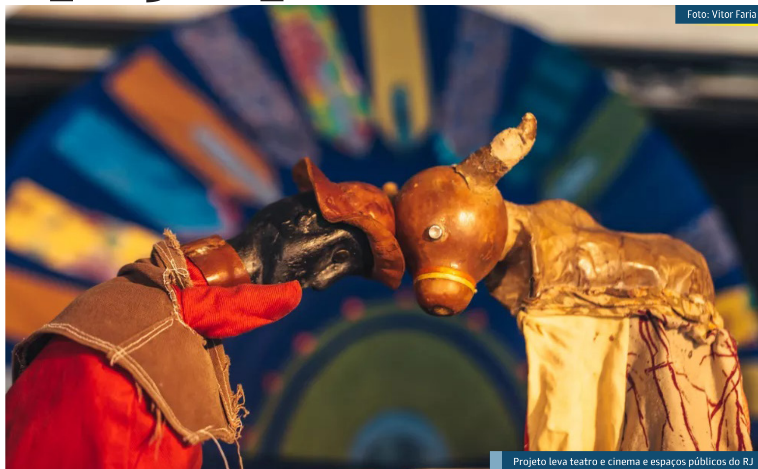
Projeto leva teatro e cinema e espaços públicos do RJ

Com música e humor, os artistas contam a história de amor de Benedito e Rosinha,