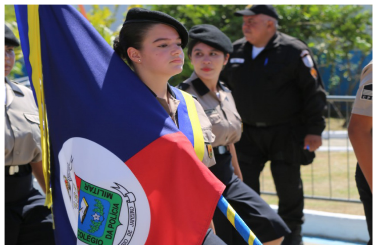
Os interessados deverão acessar o edital, através do site www.sepm.rj.gov.br