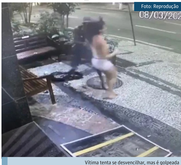
Vítima tenta se desvencilhar, mas é golpeada

A empresária foi socorrida para o Hospital Miguel Couto, no Leblon, e já recebeu alta. A vítima mora em Montpelier, no Sul da França, e esteve pela