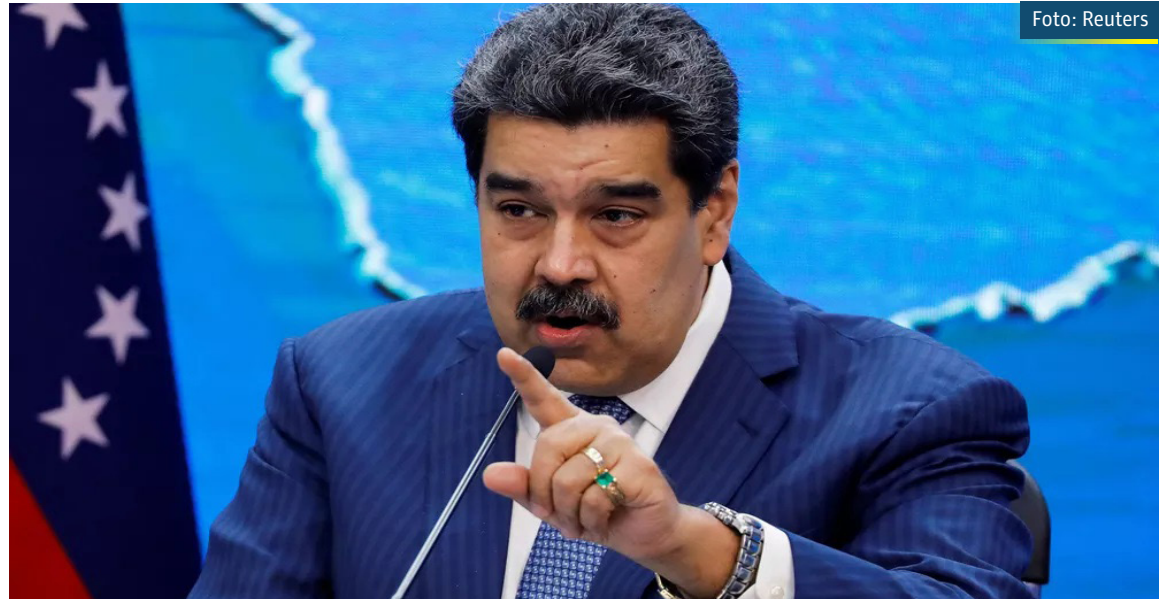
O presidente da Venezuela, Nicolas Maduro, durante entrevista coletiva no Palácio Miraflores, em Caracas

Foi assim que na hora de negociar, Biden recorreu a Maduro e não a Juan Guaidó, reconhecido pelo governo americano como o presidente encarregado da Venezuela. Outrora incensado pelos EUA, o então líder da oposição a Maduro foi recebido na Casa Branca e ovacionado no Congresso, durante um discurso de Trump sobre o Estado da União. Agora, ele sequer foi consultado sobre a reunião, segundo revelou Car-