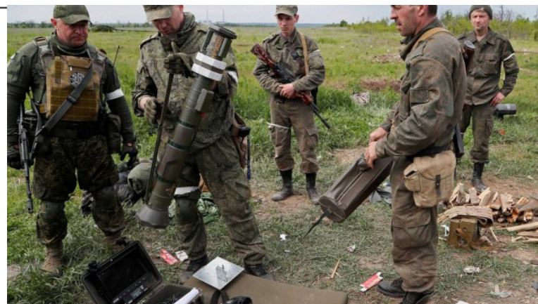
Os militares eram membros da Guarda Nacional e rejeitaram realizar uma "operação especial" na Ucrânia.

O tribunal concluiu, segundo um comunicado publicado na quarta-feira, que os militares rejeitaram "arbitrariamente cumprir uma missão oficial". O tribunal disse que examinou os "documentos necessários" e interrogou os responsáveis da Guarda Nacional, uma força de segurança inter-