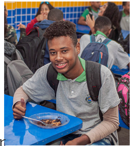
Ao todo, 15 mil alunos são beneficiados com a nova alimentação