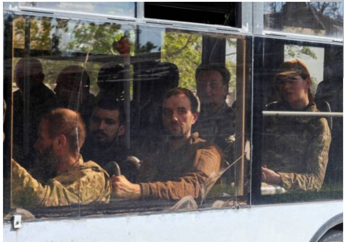
Um ônibus com prisioneiros de guerra ucranianos que se renderam em Mariupol

No sábado, o presidente da Ucrânia, Volodymyr Zelensky, demonstrou disposição a retomar o diálogo, contanto que os prisioneiros de guerra de Mariupol não fossem exe-