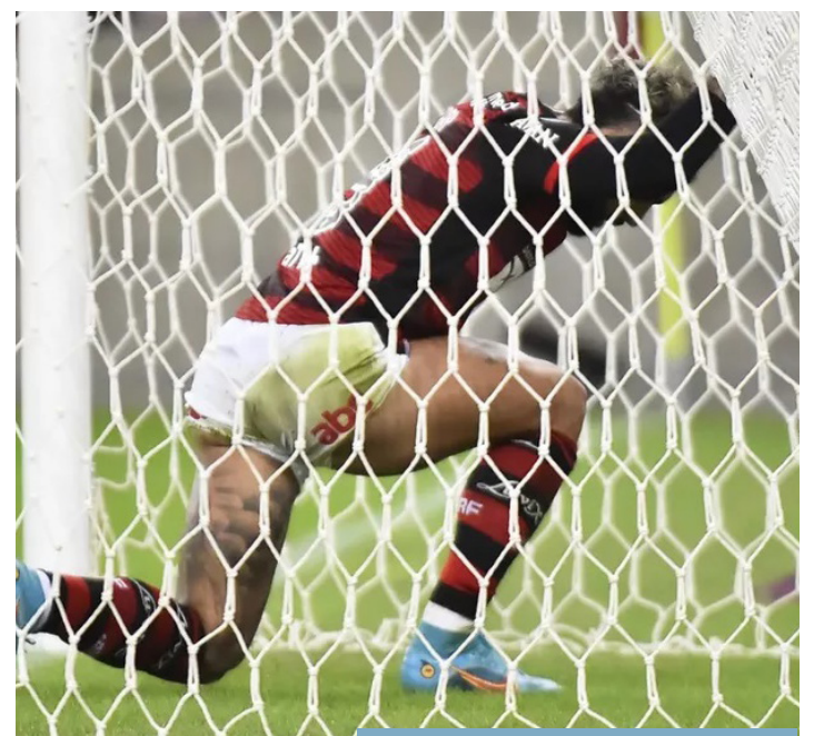
GABIGOL LAMENTA GOL PERDIDO

O jejum do atacante na competição não se repete desde 2015, quando ainda atuava pelo Santos. O atacante ficou sem marcar ou dar assistências também por cinco partidas consecutivas: entre as rodadas 29 e 35 daquele ano (ele foi desfalque do Peixe nas rodadas 31 e 32). Voltou a marcar na 38ª rodada (também não jogou pelo Santos nas rodadas 36 e 37) diante do Athletico-PR. Encerrou o jejum com maestria, com dois gols e duas assistências na goleada por 5 a 1.