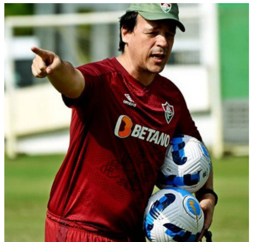
FERNANDO DINIZ TEM CHAMADO A ATENÇÃO POR ESTILO DE JOGO DIFERENTE