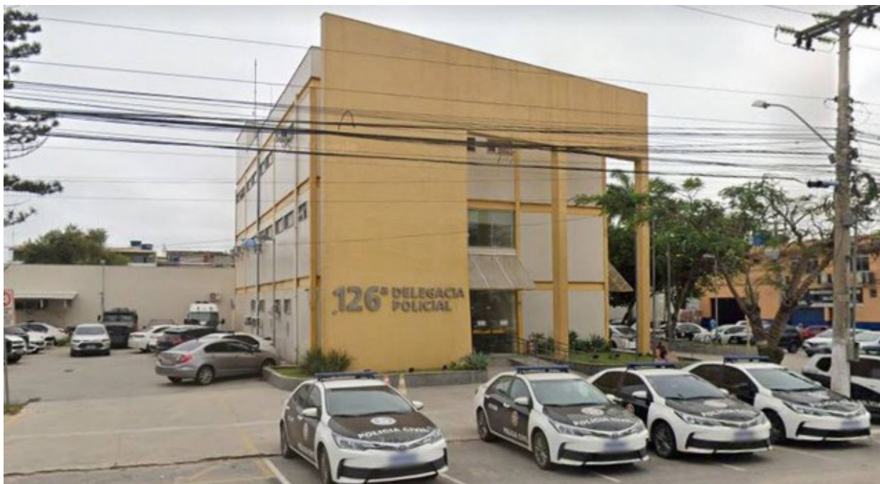
Caso está sendo investigado pela 126ª DP (Cabo Frio)