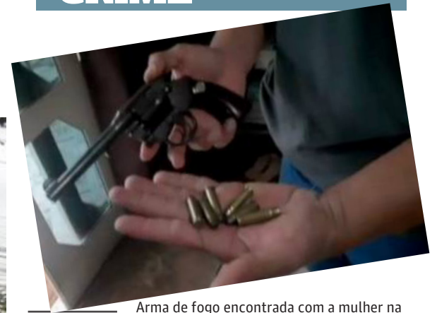
Arma de fogo encontrada com a mulher na hora em que ela foi presa

20 de novembro do ano passado. As investigações e um trabalho de inteligência da distrital revelam que a companheira da vítima seria mandante do assassinato. O crime teria sido motivado por conta de uma apólice de seguro de vida, no valor de R$ 1,2 milhão, em nome de Jonas.