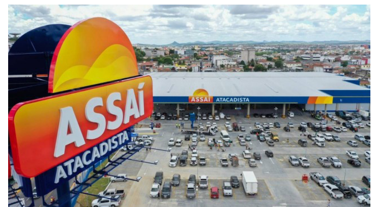
Nova loja do Assaí será inaugurada nos próximos meses em São Gonçalo

A consultoria de Recursos Humanos Luandre está com a