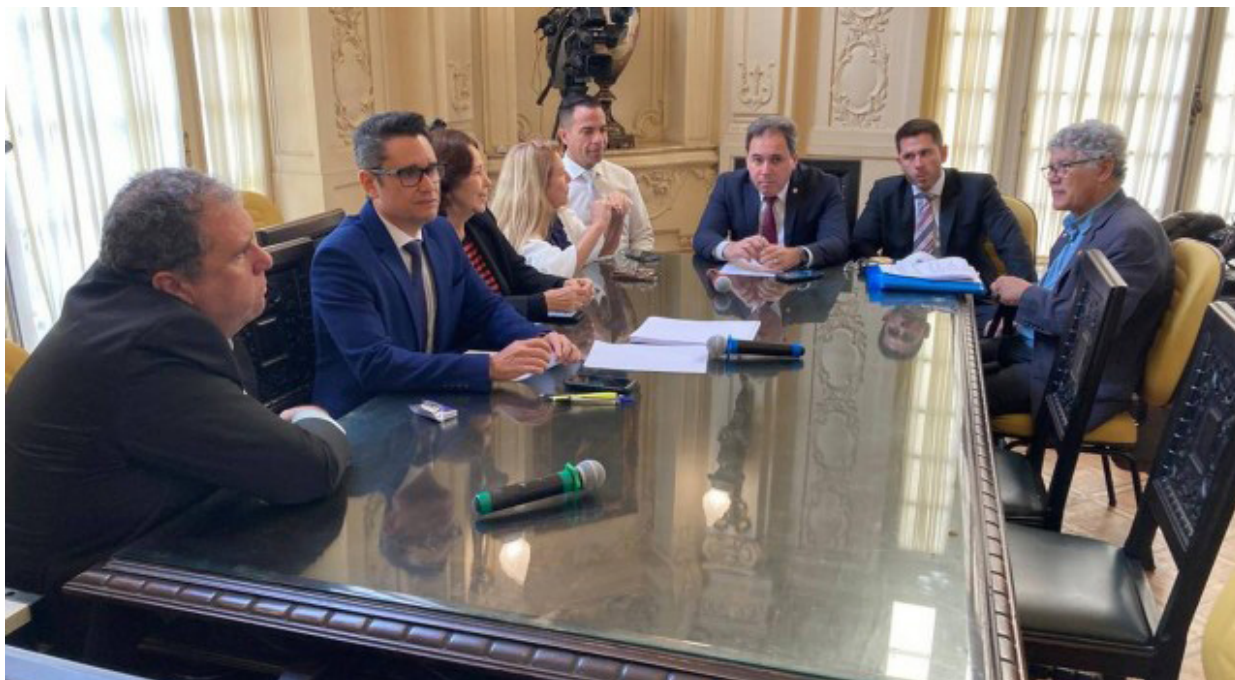
Os vereadores do Conselho se reuniram nesta quinta-feira

A Polícia Civil não encontrou escuta nos gabinetes dos vereadores da Comissão de Ética da Câmara Municipal do Rio, que investiga denúncias contra Gabriel Monteiro, em varredura realizada nesta terça-feira. O pedido dos parlamentares à polícia, de buscar possíveis grampos, decorre das ameaças que eles têm recebido. Youtuber e ex-PM, Montei-