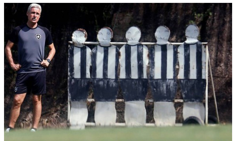
LUÍS CASTRO

Por outro lado, as sequências positivas de sua trajetória como treinador são recentes, de pouco antes de assumir o Botafogo. O recorde de Castro são oito vitórias seguidas com o Shakhtar Donetsk em 2021 e 18 jogos sem perder entre 2021 e 2022 no Al Duhail.