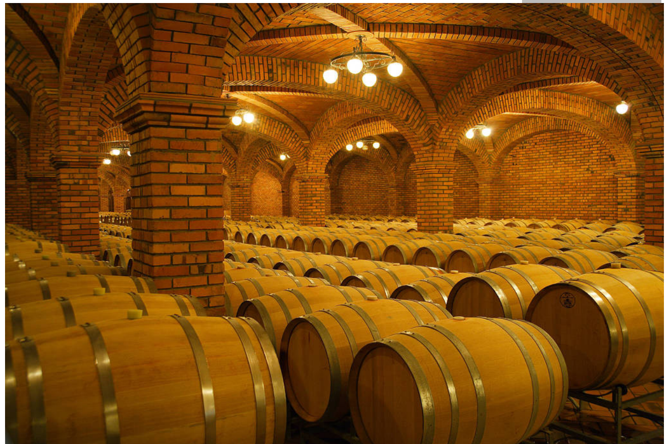
Barris de vinhos em vinícola em Bento Gonçalves (RS)

"O nosso objetivo é fortalecer a imagem da gestora como uma casa cada vez mais