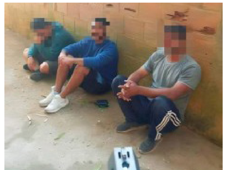
Paquistaneses foram mantidos reféns sob a mira de arma dos criminosos

Durante as investigações, foi possível esclarecer que o grupo é formado por ao menos nove