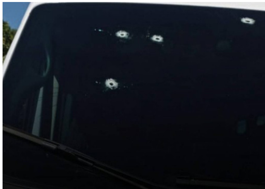
Van que seria utilizada por autoridades foi alvejada por ao menos quatro tiros no para-brisa

O Palácio Guanabara confirmou o ataque. Segundo o comunicado, "uma equipe do Gabinete de Segurança Institucional do Governo do Estado do Rio que fazia uma precursora de uma agenda