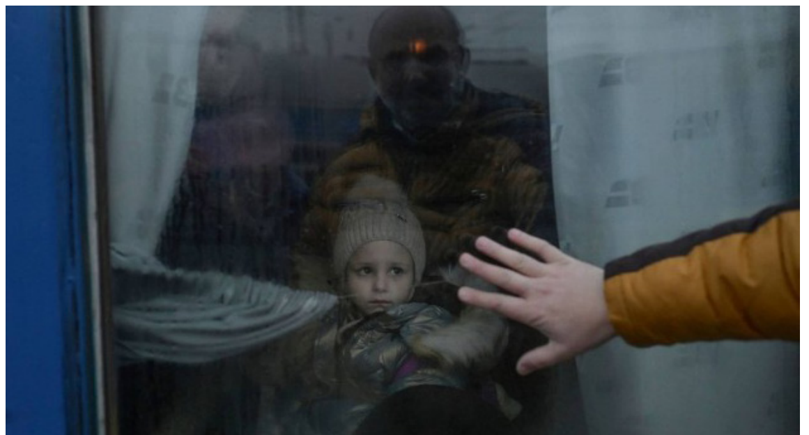
Pai se despede de filha em evacuação na estação central de trem em Odessa, em 7 de março de 2022

Em março, a ONU começou a alertar sobre o risco de crianças ucranianas serem forçadas à adoção, especialmente os cerca de 91 mil menores que vivem em instituições ou internatos, muitos deles localizados no Leste do país,