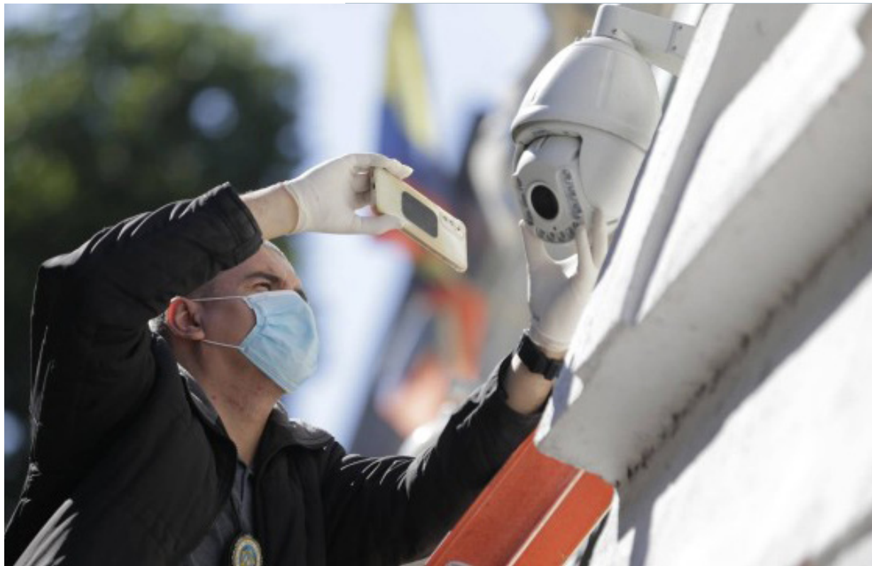
Perito analisa câmera usada para monitorar ações do Batalhão de Choque, no Centro do Rio

Uma equipe da 21ª DP (Bonsucesso) realiza uma perícia na manhã desta quarta-feira na loja onde está instalada a câmera de segurança que monitorava policiais militares do Batalhão de Choque, no Centro do Rio. O equipamento teria sido colocado por uma das mulhe-