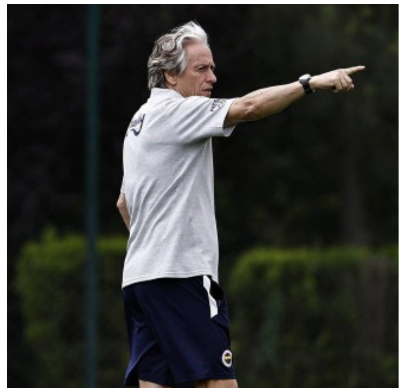
JORGE JESUS EM TREINO PELO FENERBAHÇE

O Fenerbahçe tem mais dois jogos amistosos marcados. No sábado enfrenta o Tirana, e no dia 2 de julho, o Partizan. Jesus e sua equipe estreiam na pré-eliminatória da Liga dos Campeões no dia 20 de julho, contra o Dinamo.