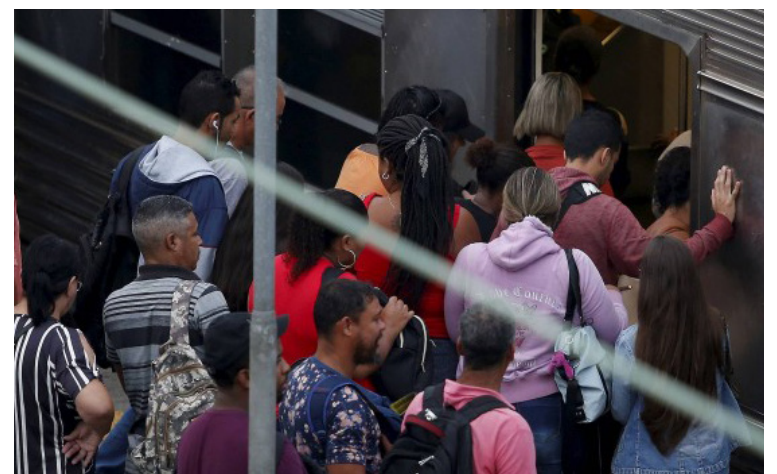
Supervia é multada em mais de R$1 milhão

A empresa afirma que foram paralisações pontuais, com atrasos pontuais. Ainda segundo a Supervia, a duração da paralisação foi de duas horas no dia 24 de agosto de