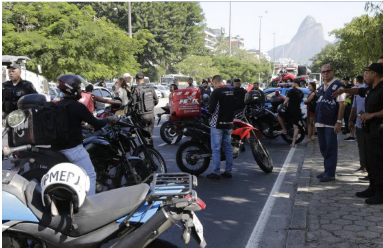
Operação apreende motocicletas em situação irregular na Lagoa

As polícias Militar e Civil, em parceria com a Secretaria municipal de Ordem Pública (Seop), fizeram nesta quinta-feira uma operação conjunta para identificar motociclistas que praticam crimes em vários bairros da Zona Sul do Rio. Até 12h, ao menos 50 motos haviam sido apreendidas. Todas elas tinham algum tipo de irregularidade,