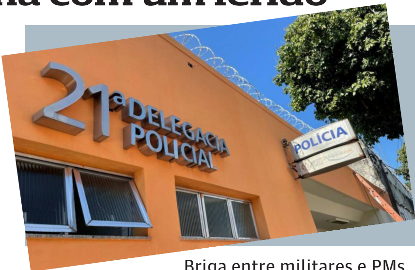
Briga entre militares e PMs termina com um ferido

— Foi uma confusão generalizada, os seguranças retiraram os militares e a briga confinou do lado de fora. Um policial militar que não estava envolvido na confusão