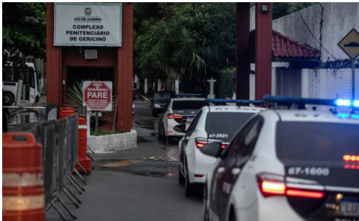
Fachada da entrada do Complexo do Gericinó em 13/04/2021.

Um subdiretor de uma unidade prisional da Secretaria estadual de Administração Penitenciária (Seap) foi exonerado do cargo, na última quarta-feira. O afastamento do policial penal ocorreu depois de um detento do Presídio Plácido de Sá Carvalho, localizado no Complexo do Gericinó, na Zona Oeste do Rio, denunciar que o agente fazia parte de um bando que pediu R$ 35 mil para não sequestrar a mulher do interno.