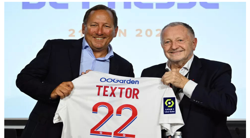
JOHN TEXTOR VAI SE TORNAR O ACIONISTA MAJORITÁRIO DO LYON

Na segunda-feira, o Lyon anunciou o acordo com John Textor para ele se tornar o acionista majoritário do clube francês. Com o movimento da Cannae, o empresário americano conseguiu uma linha de crédito de até € 523 milhões (cerca de R$ 2,8 bilhões) para fechar a compra das ações do Lyon.