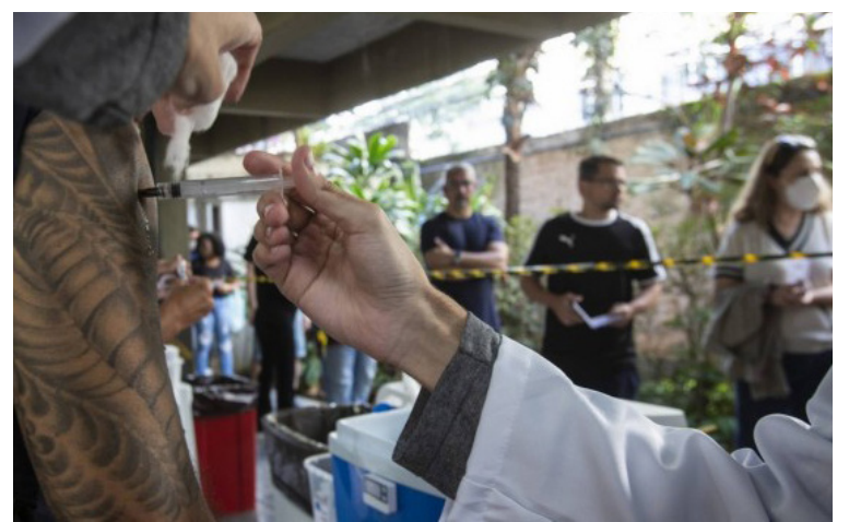
Fila da vacinação contra a Covid-19 no Tijuca Tênis Clube

Um levantamento feito pelo Centro de Informações Estratégicas de Vigilância em Saúde (CIEVS), vinculado à SES, reforçou a importância da vacinação. Segundo o órgão, após uma análise do perfil dos internados com Covid-19 nas unidades da rede estadual de Saúde entre os