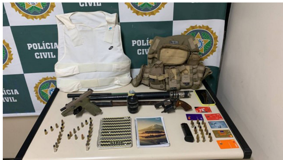
Coletes à prova de balas, armas e munição estão entre as apreensões

Segundo o depoimento prestado por uma das vítimas na 16ª DP (Barra da Tijuca), ele estava com a namorada na fila quando cinco