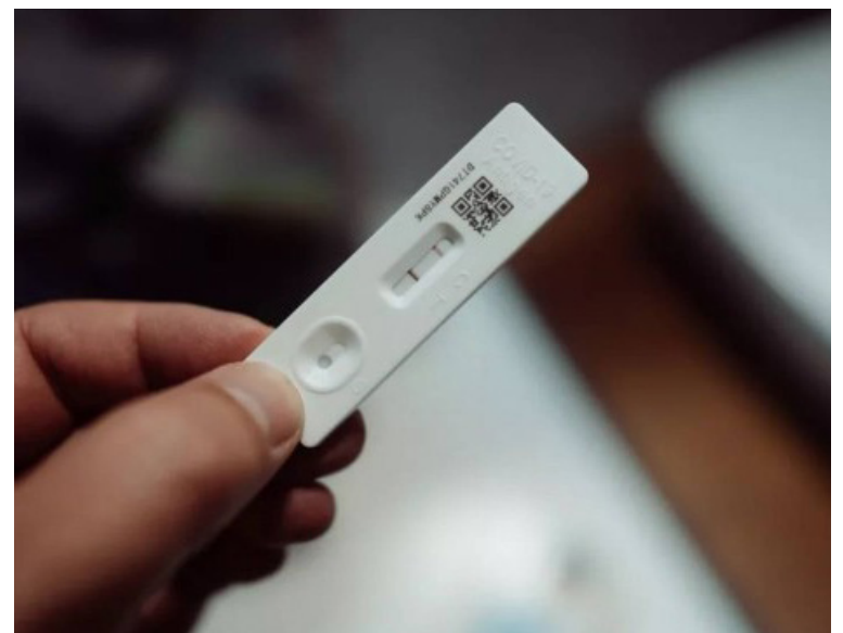
Teste rápido de Covid-19.

Embora qualquer pessoa possa ser reinfetada nessas circunstâncias, alguns grupos podem estar mais vulneráveis. São eles: pessoas não vacinadas ou que não receberam todas as doses recomendadas; pessoas que pegaram Covid-19