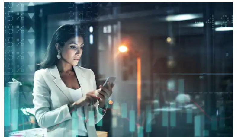
No país, já são mais de 18 mil agentes autônomos em atuação, segundo dados mais recentes da Ancord (Associação Nacional das Corretoras de Valores).

dam para obter a certificação, já são apresentados para os escritórios que têm vagas de acordo com o seu perfil”, explica, por nota, a empresa.