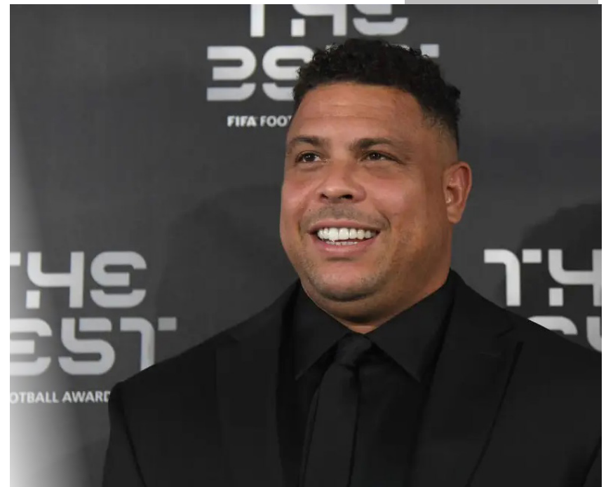
A startup Beyond Films tem investimento avaliado em R$ 40 milhões para os próximos anos

A marca é resultado da inspiração do Ronaldo no mercado geek. Em fevereiro de 2021, ele ampliou os investimentos na área e estreitou a relação com o mundo dos games e e-sports, com a qual já tinha familiaridade.