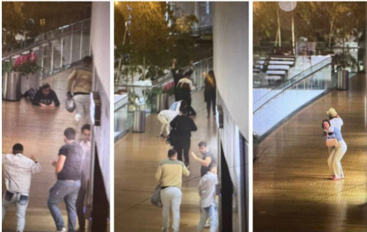
Imagens mostram um dos criminosos armados e refém

A Delegacia de Homicídios da Capital (DHC) analisa câmeras de segurança da Sara Joias e do Village Mall, na Barra da Tijuca, um dos shoppings mais luxuosos da cidade, para identificar ao menos 10 bandidos que entraram na loja no último sá-