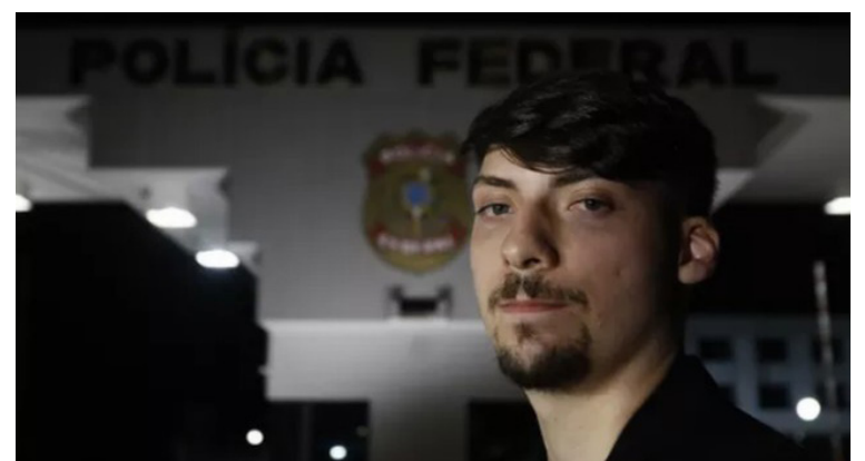
Jair Renan Bolsonaro comparece a Superintendência da Polícia Federal em Brasília para depor

A investigação já obteve indícios de que a arquiteta respon-