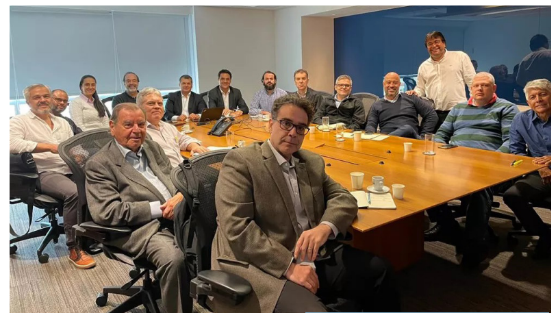
COMISSÃO ESPECIAL SE REÚNIU PARA COMEÇAR A AVALIAR OFERTA DA 777 PARTNERS PELA SAF DO VASCO

A Comissão Especial teve acesso pela primeira vez aos documentos. Ela terá 15 dias, prorrogáveis por mais 10, caso necessário, para analisar e emitir um parecer favorável ou não.