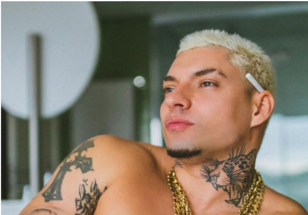
O rapper Filipe Ret

Filipe Ret, ou Filipe Cavaleiro de Macedo da Silva Faria, é garoto carioca da Zona Sul. Cresceu no Catete, na subida do Morro Santo Amaro. Aos 16 anos, quando começava a rabiscar as primeiras rimas, ficou sabendo da Batalha do Real, na Lapa. Achou que estivesse pronto para ganhar no freestyle,