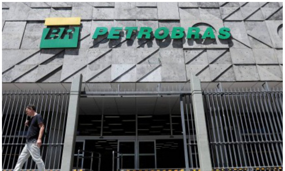
Fachada do prédio da Petrobras, localizado no centro do Rio de Janeiro

A estatal não anunciou alteração no preço do diesel.