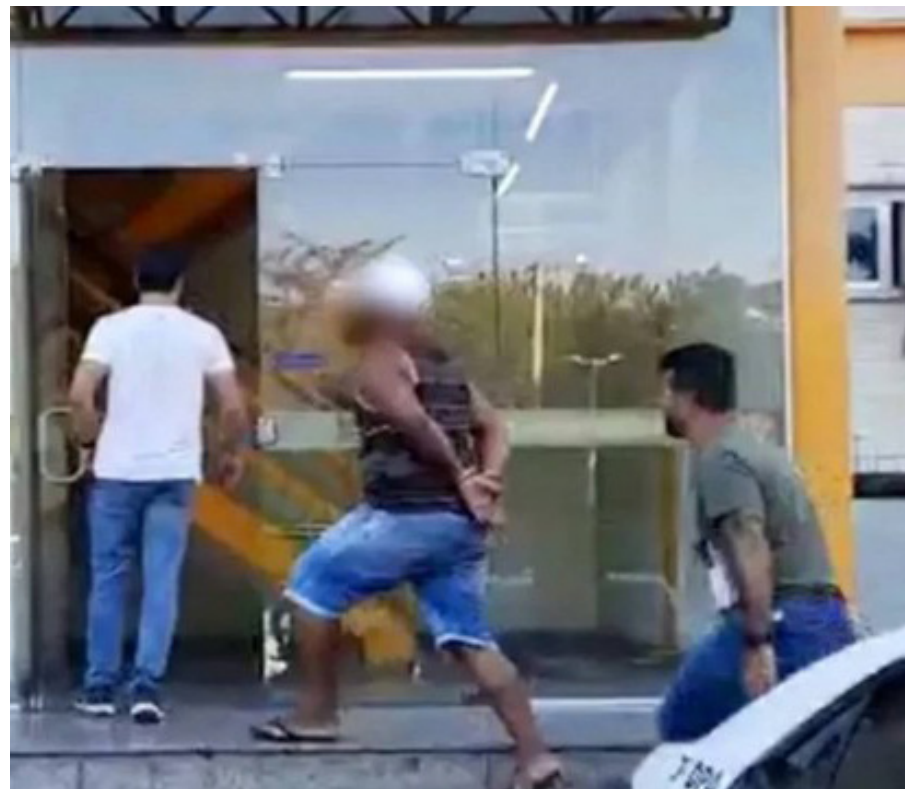
Padrasto é preso por estuprar e manter menina de 11 anos em cárcere privado por dois anos

O caso chegou à polícia no início da manhã de sexta-feira (14), após a internação da menina, que deu dar à luz um bebê dentro de casa, e a mãe e o padrasto alegavam que, até o momento do parto, não sabiam da gravidez. Os profissionais de saúde e assistentes sociais que aten-