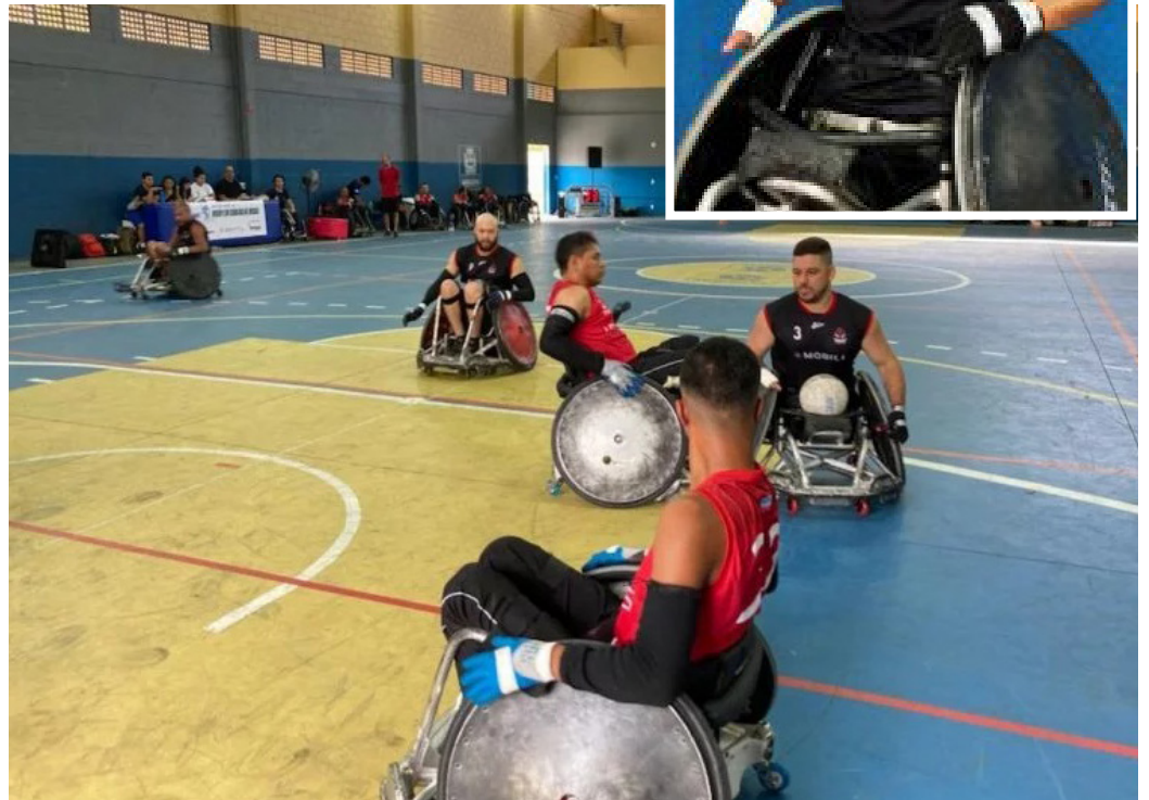
Torneio Regional Sudeste da modalidade aconteceu no último fim de semana, na Vila Olímpica Municipal,

"Foi um desafio participar da organização e também jogar. Mas foi muito gratificante, porque aconteceu na cidade em que nasci. Foi uma das melhores experiências que já tive. Que venham mais oportunidades assim. Quanto mais torneios, mais visibilidade para o rugby em cadeira de rodas e mais oportunidades de formar novos profissionais e classificar atletas", declarou o rapaz, que tem 31 anos e dá expe-