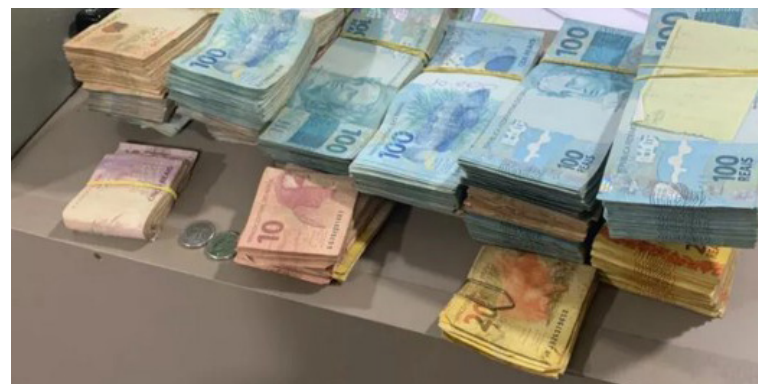
Operação da polícia federal na empreiteira Construservice com a Codevasf, comandada pelo centrão