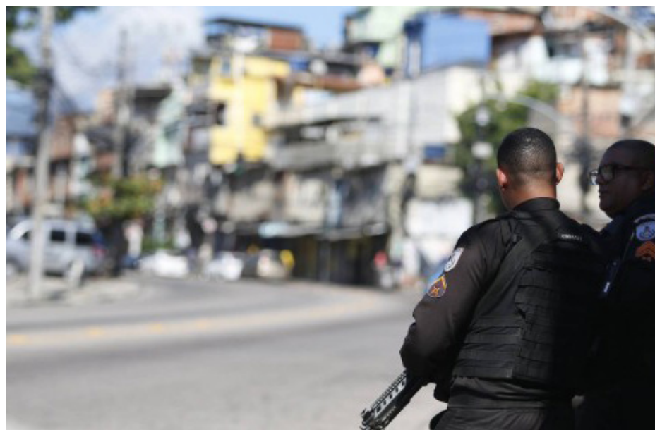
A PM relatou em seu Twitter os ataques sofridos pelas equipes que estão no Complexo

Segundo uma outra nota da PM, "não houve confronto envolvendo os policiais