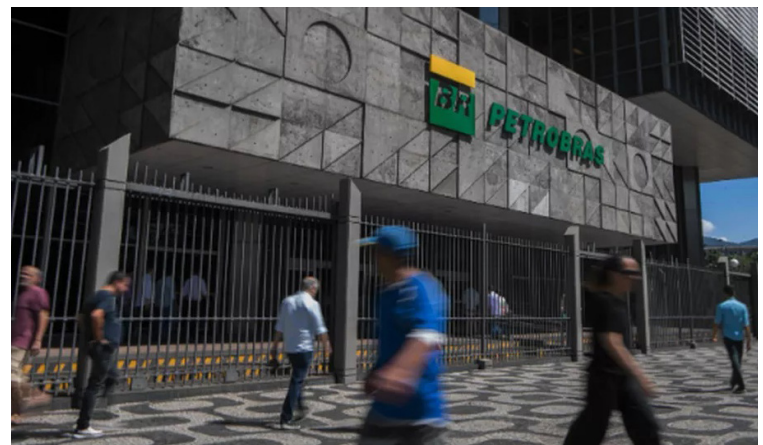
Sede da Petrobras, no Rio de Janeiro

Até agora, o governo já conta com R$ 26 bilhões decorrentes da privatização da Eletrobras e R$ 18 bilhões de dividendos do BNDES. O