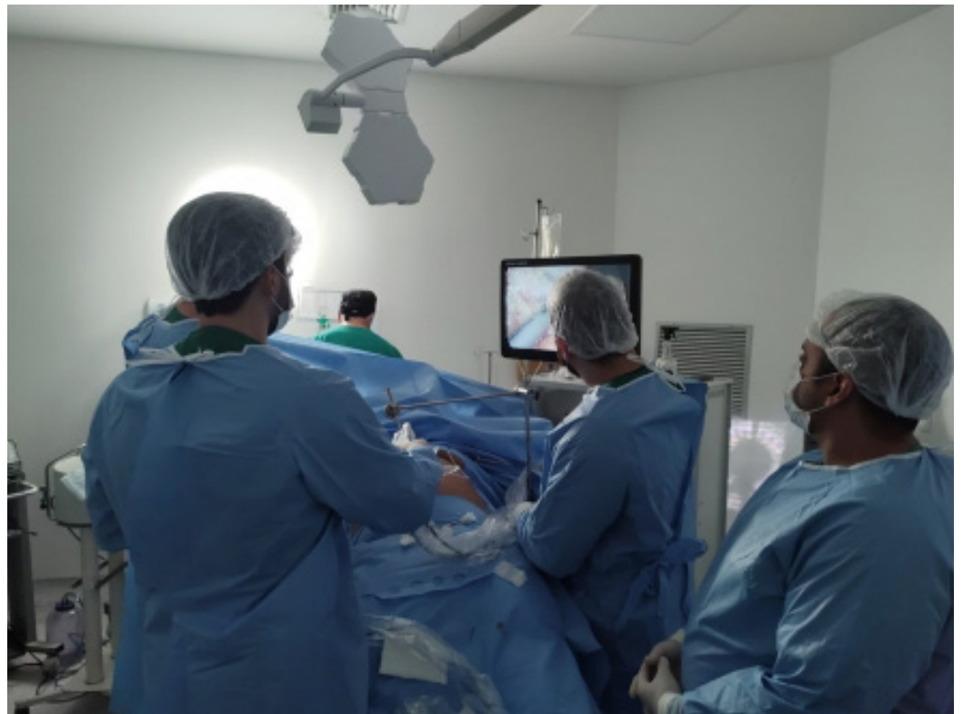
Paciente é uma mulher de 32 anos e foi operada nesta quinta-feira (21)