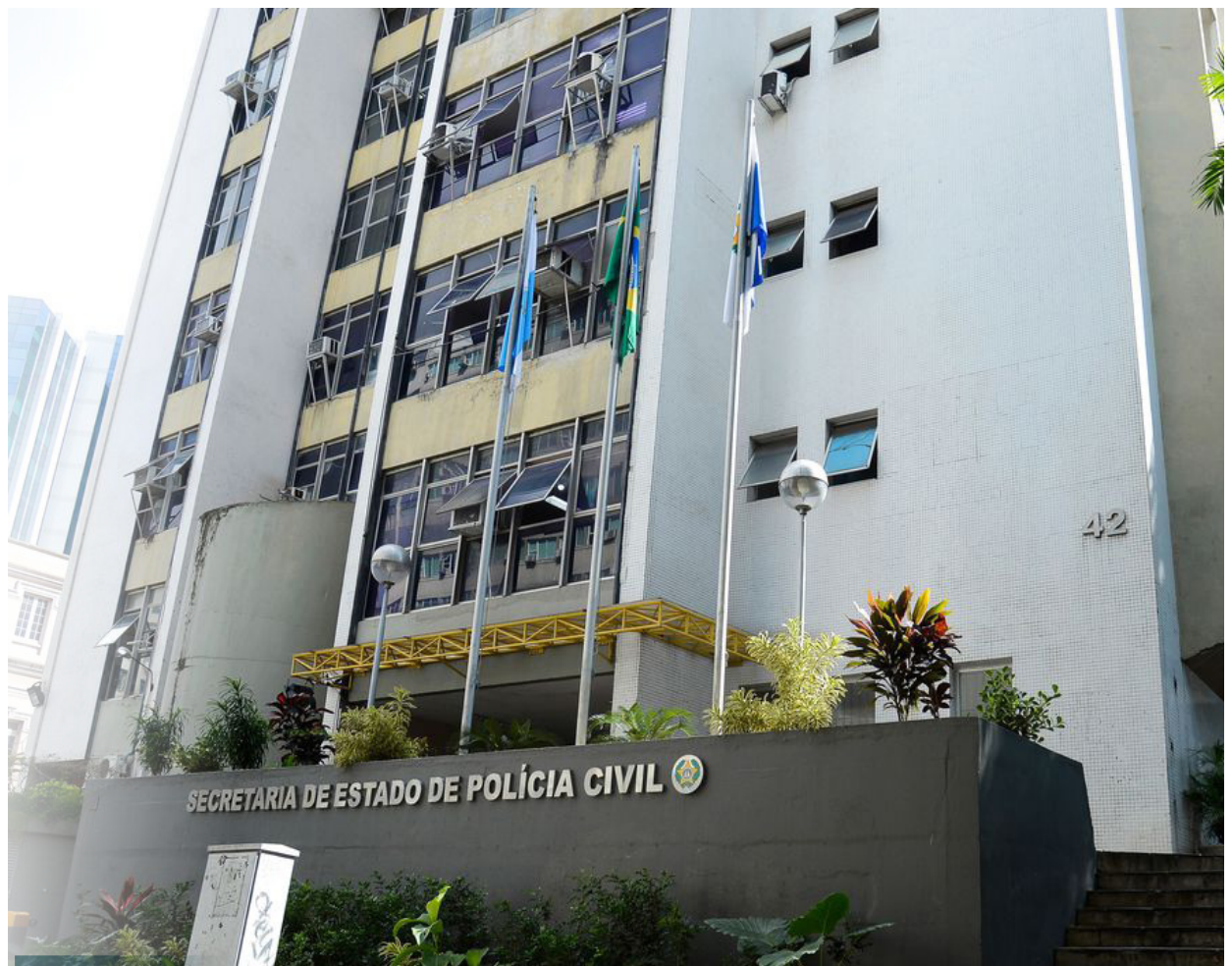
Menor foi morto em operação policial em São Gonçalo, em 2020