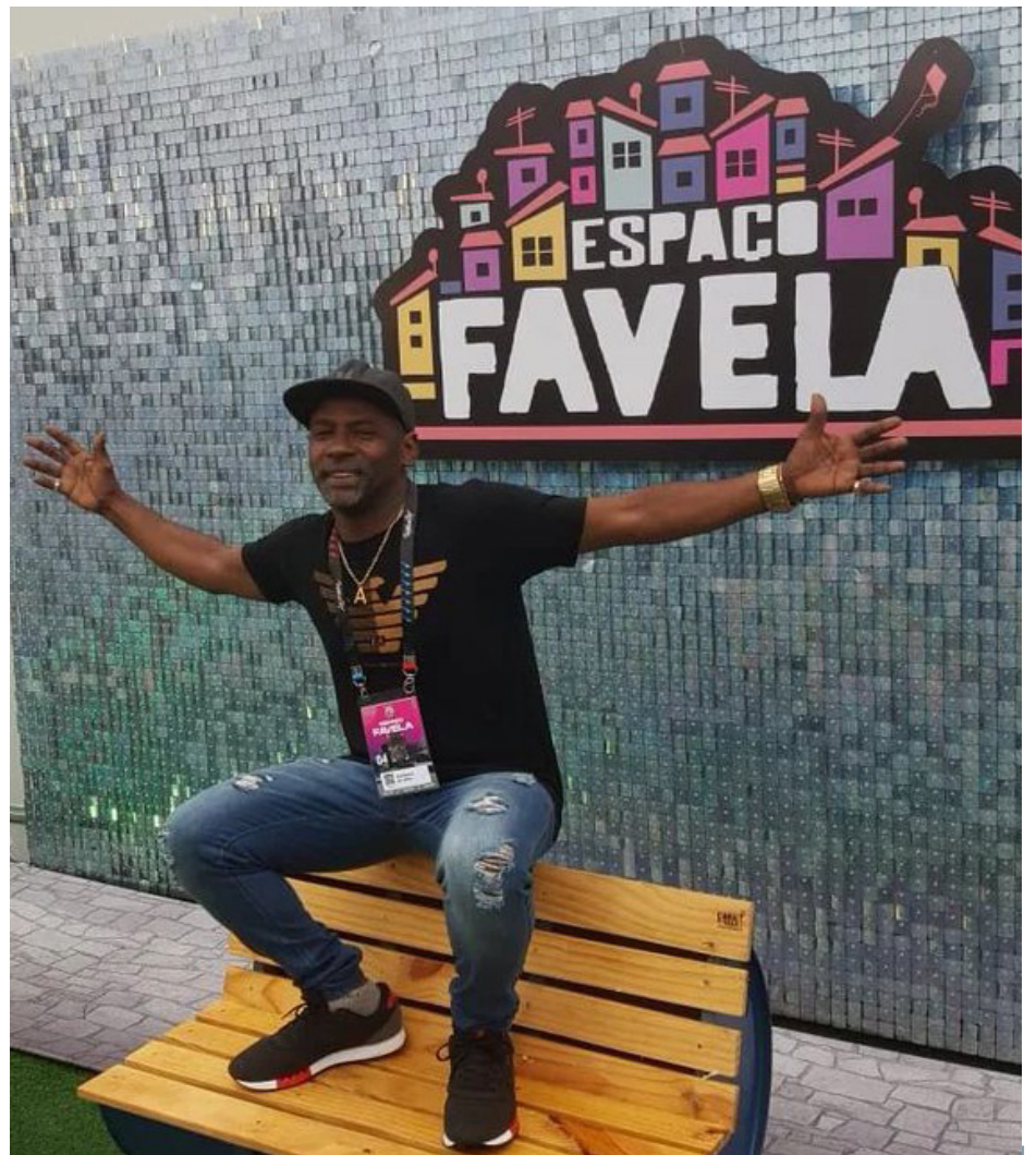
Dessa vez, os alvos foram as agências do Banco do Brasil e da Caixa Econômica Federal

Além disso, a Polícia Civil reforça que a segurança no Rock in Rio é privada e de responsabilidade dos organizadores do evento.