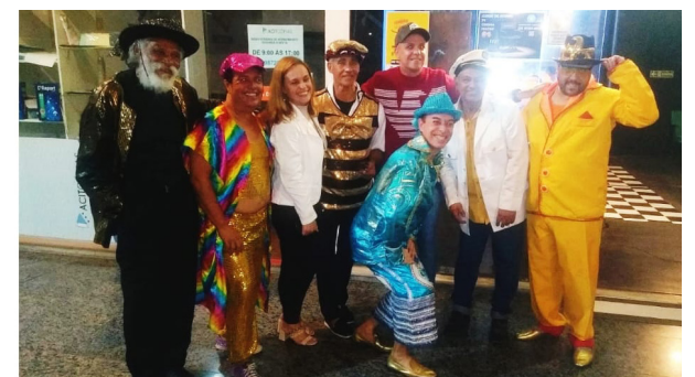
Após o espetáculo, o elenco posou para fotos ao lado de fãs e familiares em frente ao Teatro Joia