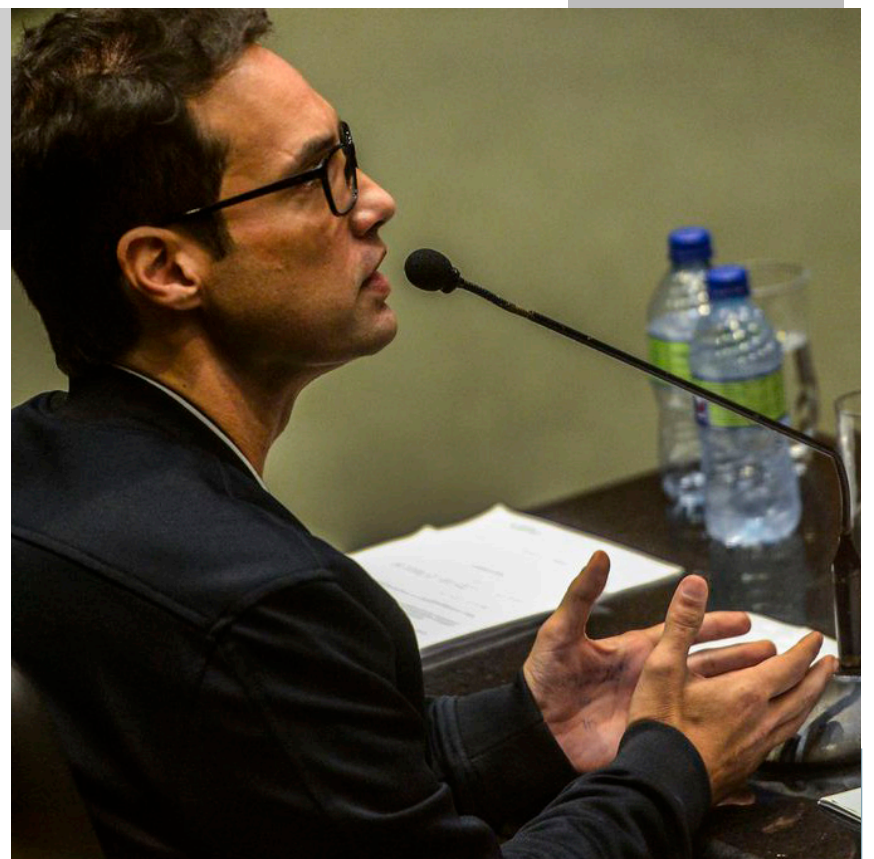
Pedido de habeas corpus foi feito com base no processo de Monique

Já no caso de Jairinho, a magistrada negou o pedido de substitui-