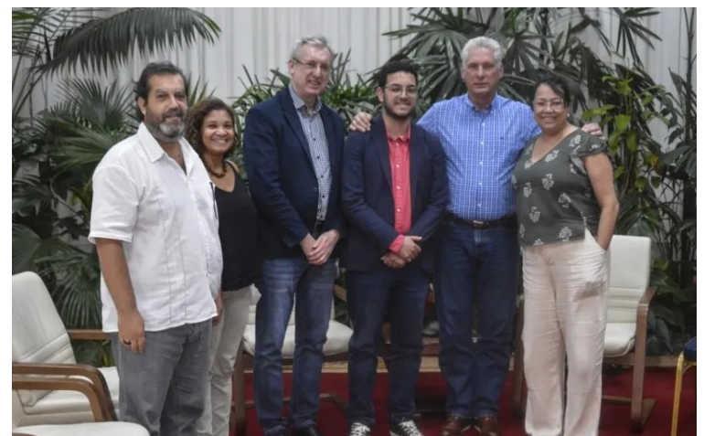
A parceria vai permitir a criação de um pólo de produção de medicamentos

“Nosso interesse é desenvolver medicamentos patente-