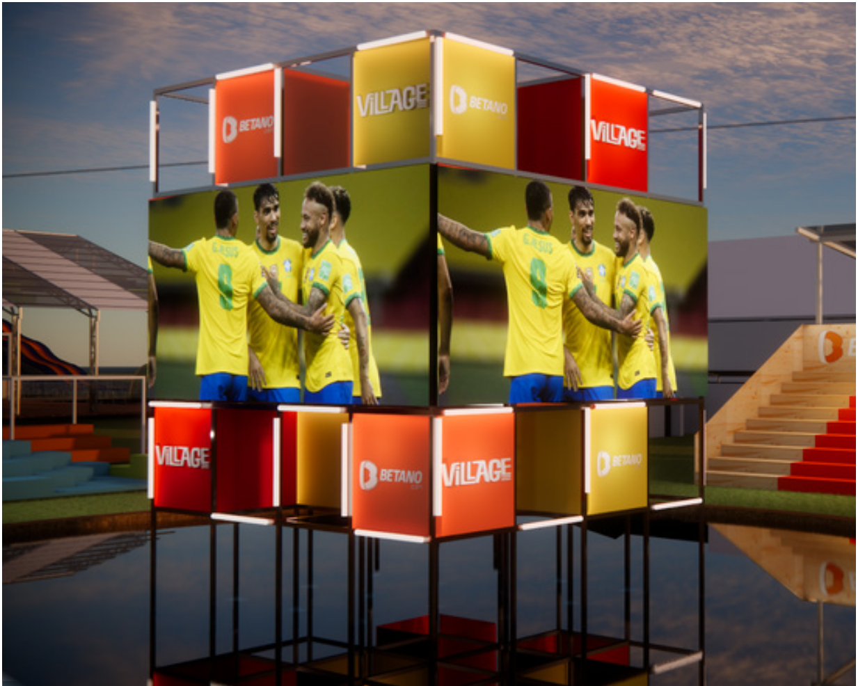
Com uma área de 30 mil m 2 , o festival terá dois palcos, diversos telões e um mar de experiências para o público

O Brasil, único país pentacampeão mundial de futebol vai contar com um festival à altura da torcida pelo hexa. O festival Village, que em 2022 recebe naming rights de Betano, passando a se chamar Village Betano, vai apresentar mais de 100 shows de estrelas da música brasileira, entre os dias 17 de novembro e 18 de dezembro, no Jockey Club Brasileiro, um dos espaços mais prestigiados pelo público no Rio de Janeiro.