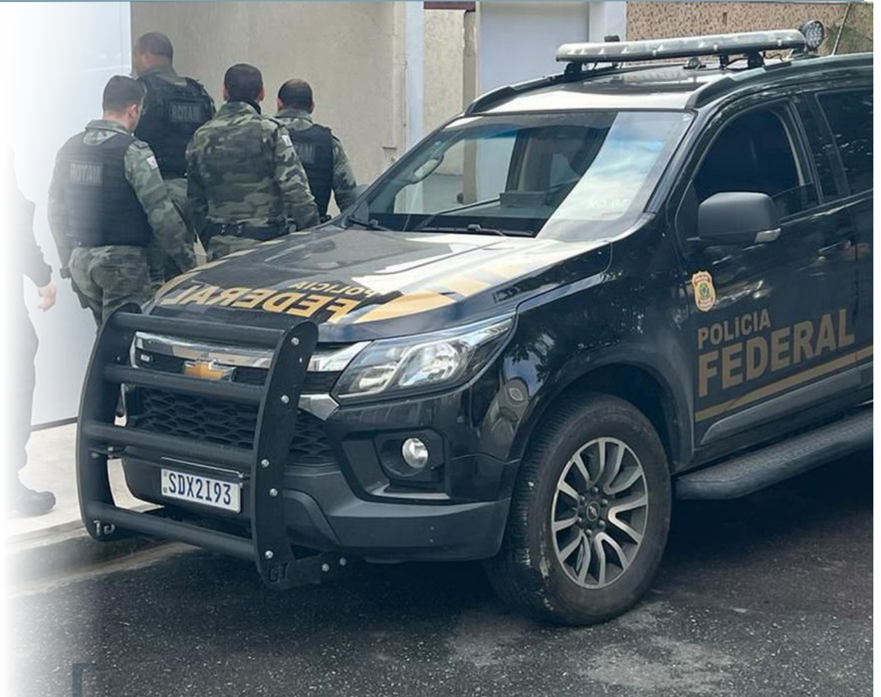
Estão sendo cumpridos sete mandados de prisão preventiva no Brasil

A Polícia Federal (PF), em parceria com a Interpol, deflagrou hoje (20) a Operação Duplo Risco a fim de desarticular organizações criminosas especializadas em tráfico transnacional de entorpecentes. A ação conta com o apoio das polícias espanhola, suíça e portuguesa.