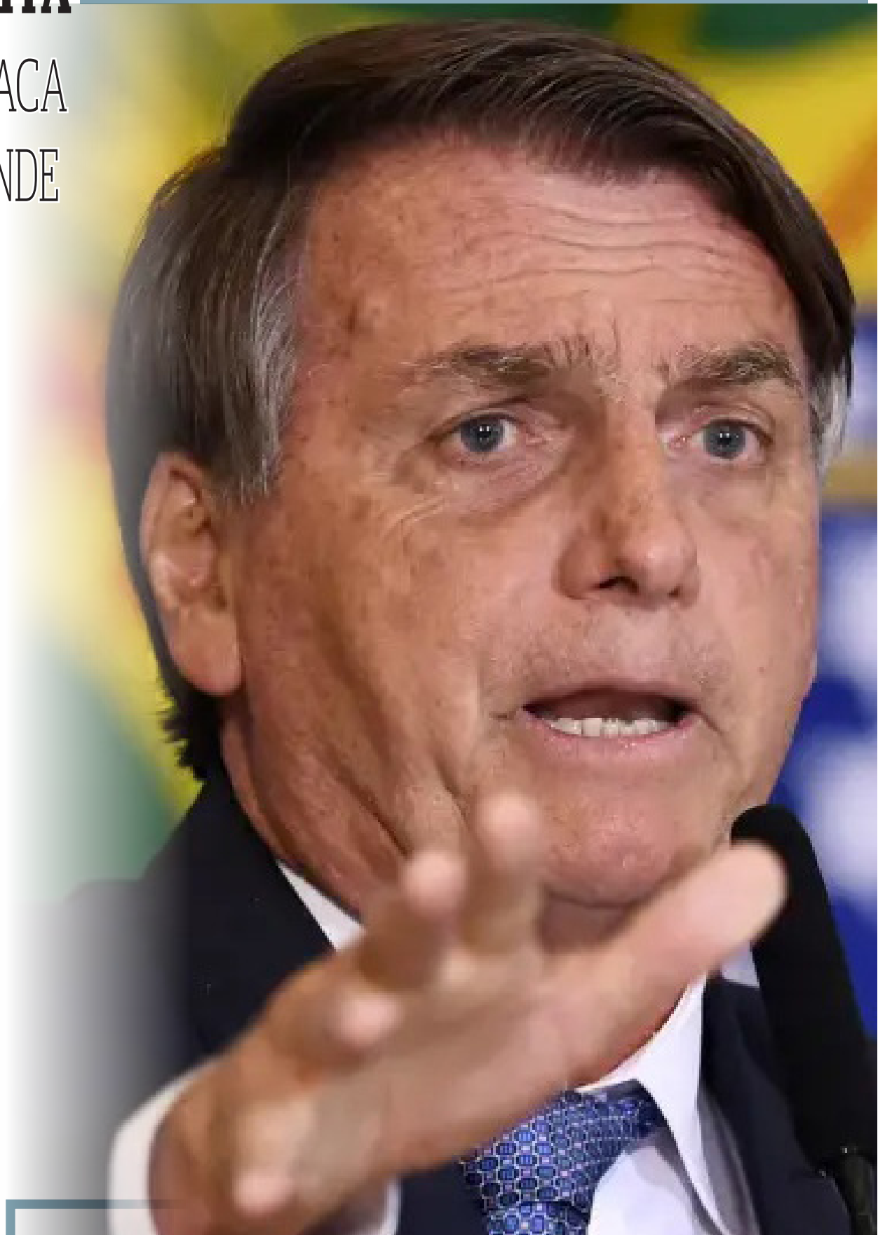
Esta é a quarta vez que Bolsonaro discursa na Assembleia Geral da ONU

Ao fazer o balanço das ações de governo, Bolsonaro disse que a economia brasileira voltou a crescer, que a inflação está em baixa e que a pobreza no país caiu de forma acentuada.