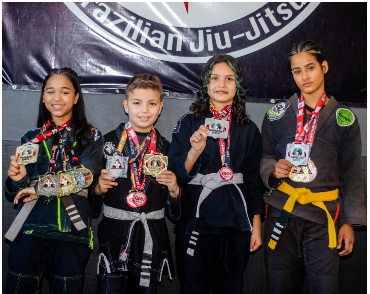
Os alunos do Centro Cultural Renan Teodoro, da equipe GF Team, deram um show no Campeonato Pan-Americano

Japeri é casa de atletas promissores. Os alunos do Centro Cultural Renan Teodoro, da equipe GF Team, deram um show no Campeonato Pan-Americano realizado no último sábado (17), na Arena da Juventude, em Deodoro, na Zona Oeste do Rio. Foram nada mais, nada menos que quatro medalhas conquistadas: uma de ouro; duas de prata e uma de bronze.