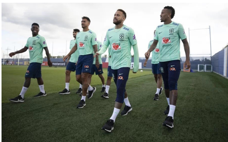
Jogadores da seleção no treinamento.

O treinador da seleção brasileira montou os titulares no treinamento com: Alisson, Eder Militão, Marquinhos, Thiago Silva e Alex Telles; Casemiro, Lucas Paquetá, Neymar, Vinicius Jr, Raphinha e Richarlison.