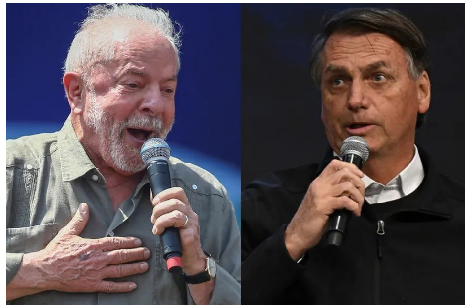
Luiz Inácio Lula da Silva (PT) à frente, com 47% das intenções de voto

O levantamento ouviu 3.008 pessoas presencialmente entre os dias 17 e 18 de setembro. Além disso, a pesquisa foi registrada na Justiça Eleitoral sob o protocolo BR-00073/2022.