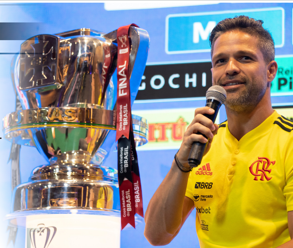
Troféu da Copa do Brasil.

Nesta edição, os dois clubes entraram só na terceira fase, por conta do regulamento dos times que disputam a Copa Libertadores. Com isso, o Timão passou por Portuguesa-RJ, Santos, Atlético-GO e Fluminense. Já o Flamengo eliminou Altos-PI, Atlético-MG, Athletico-PR e São Paulo, para chegar à final.