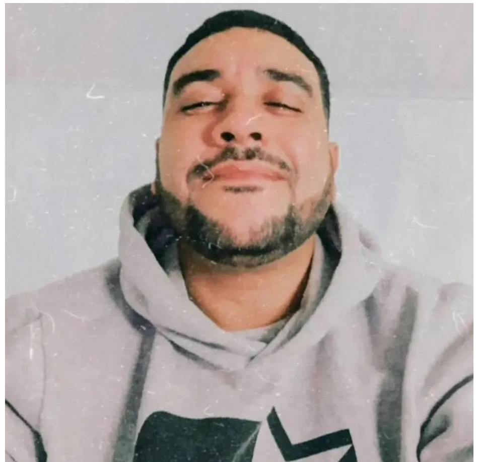
A informação não é confirmada pelo hospital, que segue protocolo de 72 horas para declarar o óbito

O caso foi para a 25ª DP (Engenho Novo). O policial preso vai passar por uma audiência de custódia nesta terça.