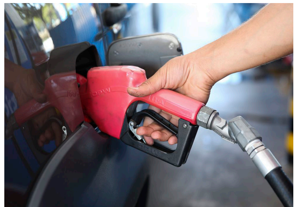
A primeira etapa da Operação Petróleo Real ocorreu no Distrito Federal nos dias 10, 11 e 12 de agosto

A primeira etapa da Operação Petróleo Real ocorreu no Distrito Federal