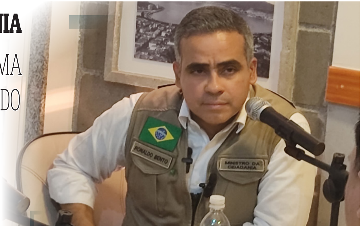
O ministro esteve na sede da Secretaria Municipal de Assistência Social e Trabalho