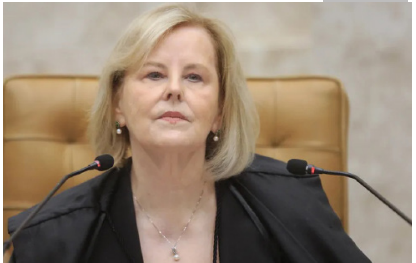
Ministra Rosa Weber, presidente do Supremo Tribunal Federal

A ministra Rosa Weber, presidente do Supremo Tribunal Federal (STF), afirmou nesta quarta-feira (21) que as urnas eletrônicas são confiáveis, auditáveis e permitem a apuração rápida dos votos dados pelos eleitores aos candidatos.