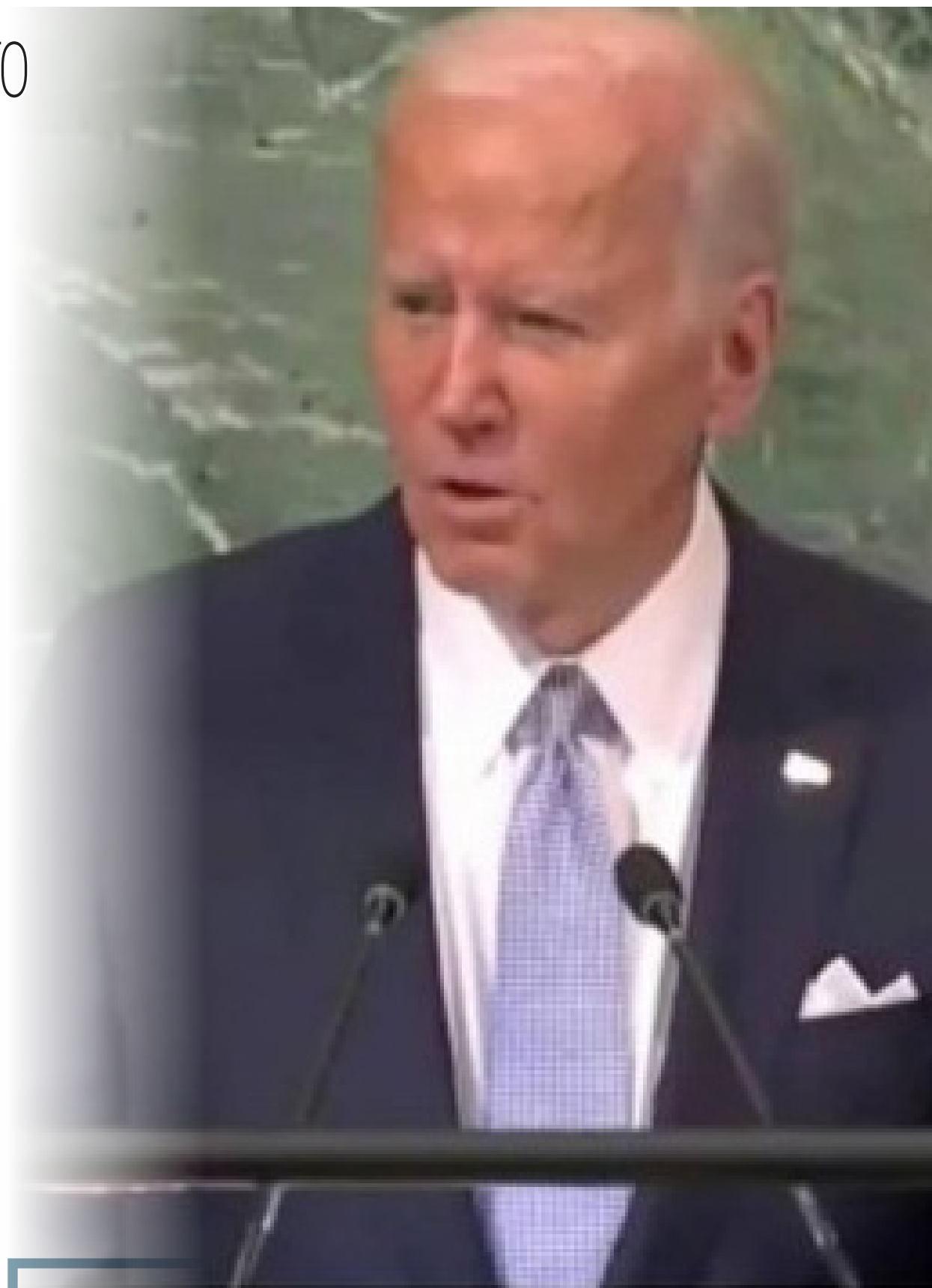
Presidente dos Estados Unidos, Joe Biden, discursa na Assembleia Geral da ONU

Na terça, as administrações pró-Rússia em regiões ocupadas da Ucrânia haviam anunciado a realização de referendos entre os próximos dias 23 e 27 sobre