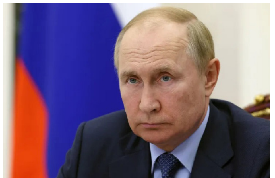
Putin enfatizou que a Rússia tem acesso a vários meios de destruição

“E aqueles que tentam nos chantagear com armas nucleares devem saber que os ventos predominantes podem virar em sua direção”, disse.