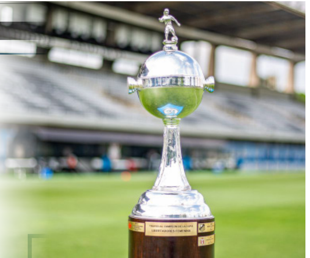
Corinthians, Palmeiras e Ferroviária representarão o Brasil

Outro brasileiro na posição de cabeça de chave é o Palmeiras, que faz parte do Grupo C ao lado de Universidad de Chile (Chile), Libertad-Limpeño (Paraguai) e um representante do Equador, que sairá do confronto entre Club Ñañas e Independiente Dragonas.