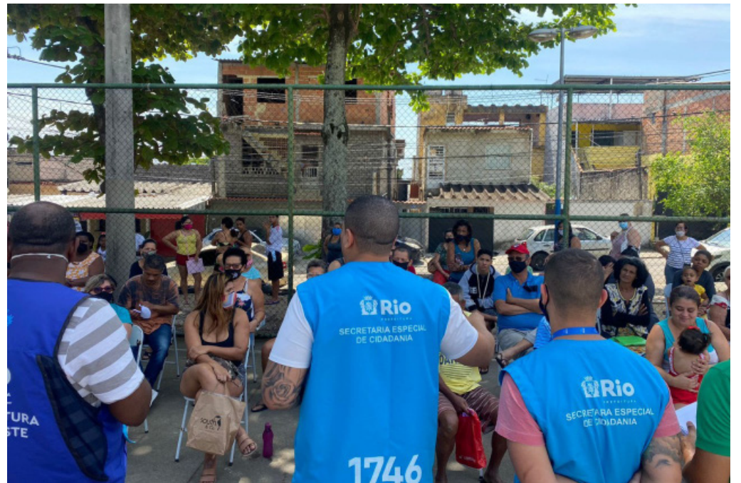
O programa Cidadania Itinerante leva serviços à população - Prefeitura do Rio

O Procon Carioca também terá equipe na ação. Os consu- midores interessados em regis- trar reclamações a respeito de qualquer empresa, ou esclarecer dúvidas sobre seus direitos de- vem levar cópia dos documen- tos pessoais, além dos compro- vantes de compra do produto ou do serviço contratado, como boletos e notas fiscais.