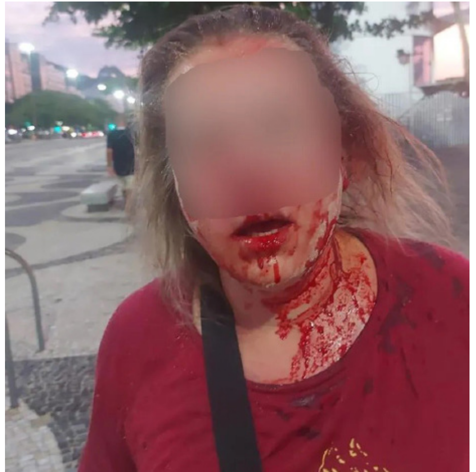
As mulheres ficaram bastante feridas, uma delas chegou a ter fratura no rosto, e foram socorridas na Unidade de Pronto Atendimento (UPA)

O crime aconteceu na areia da praia e os menores foram detidos na Avenida Atlântica, na altura da Rua Hilário de Gouveia, enquanto tentavam fugir. Eles foram encaminhados para a 12ª DP (Copacabana). Policiais militares recuperaram o aparelho celular que tinha sido roubado.