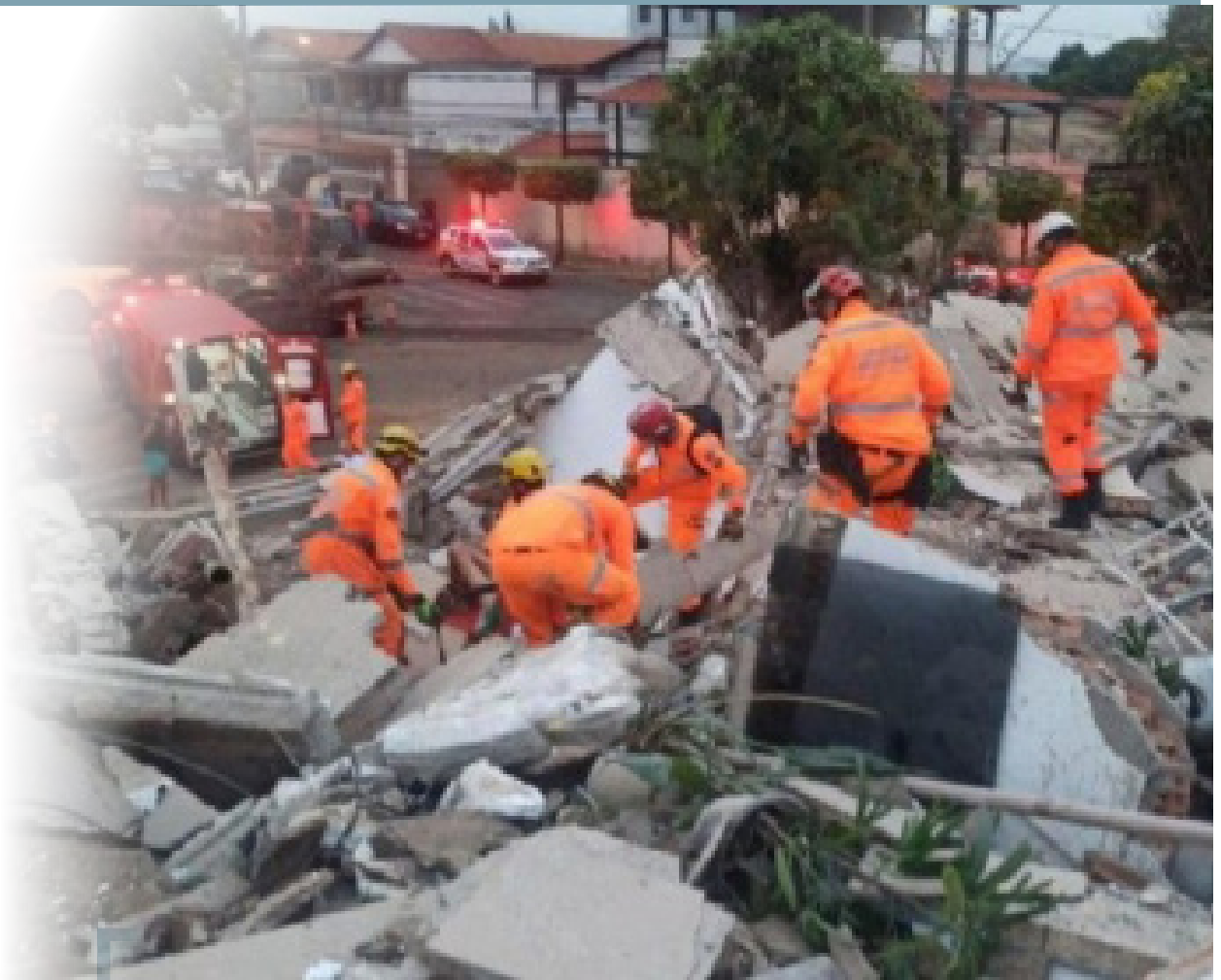
Em nota, a corporação informou que a edificação é nova e estava ainda na fase de acabamento

O desabamento de um prédio de cinco andares, ocorrido por volta das 4h50 da madrugada de quarta-feira (21), resultou na morte de uma senhora de 62 anos, em Belo Horizonte. Segundo o Corpo de Bombeiros, duas famílias moram no imóvel localizado na Rua Nilo Aparecida Pinto, 425, próximo à Praça Nossa Senhora da Paz, no Bairro Planalto