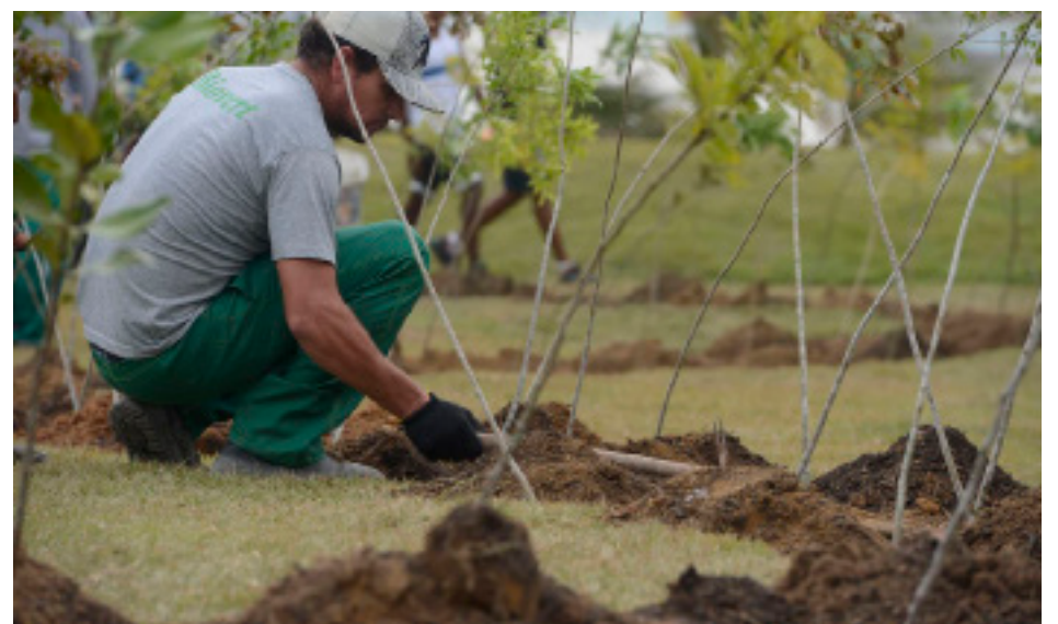
A ideia, segundo a associação, é “alinhar técnicas inovadoras de restauração florestal

De acordo com a associação, o projeto também está alinhado à Década de Recuperação dos Ecossistemas (2021-