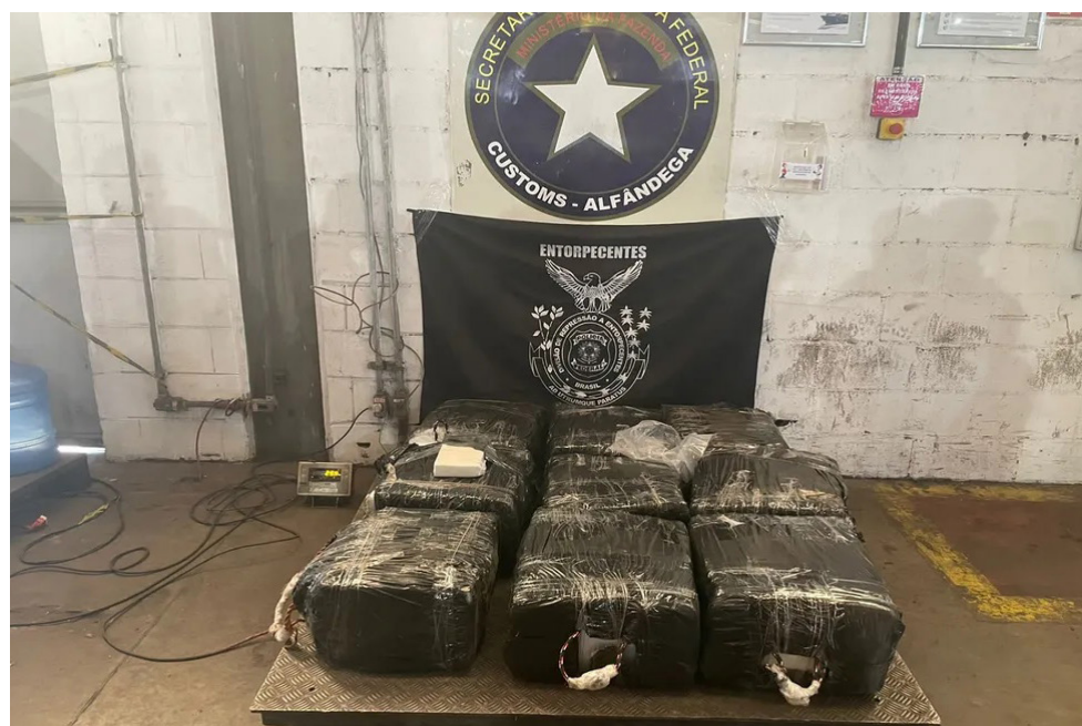
Receita e Polícia Federal apreendem cocaína no Porto de Itaguaí

Apesar disso, as equipes do 9º BPM e do COE removeram os obstáculos utilizando uma retroescavadeira. Ainda não há informações de feridos, apreensões ou feridos.