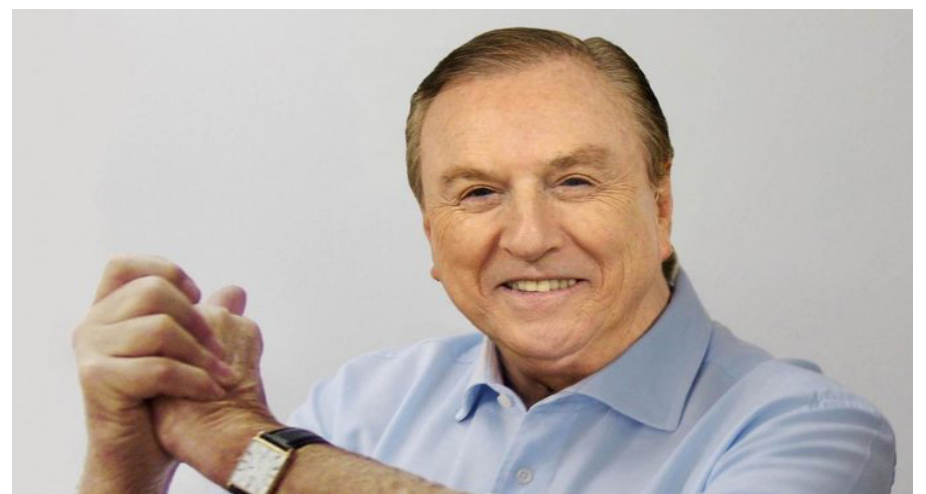
Justiça Eleitoral tem até 12 de setembro para julgar registros

A Justiça Eleitoral tem até 12 de setembro para julgar todos os mais de 29 mil pedidos de registro de candidatura para as Eleições 2022. Além de presidente, são disputados cargos de governador, senador, deputado federal e deputado estadual ou distrital.