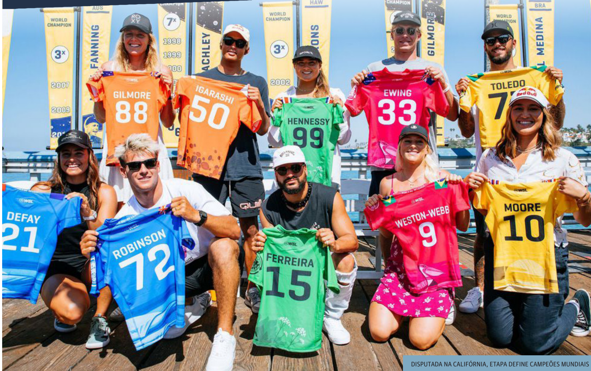
DISPUTADA NA CALIFÓRNIA, ETAPA DEFINE CAMPEÕES MUNDIAIS