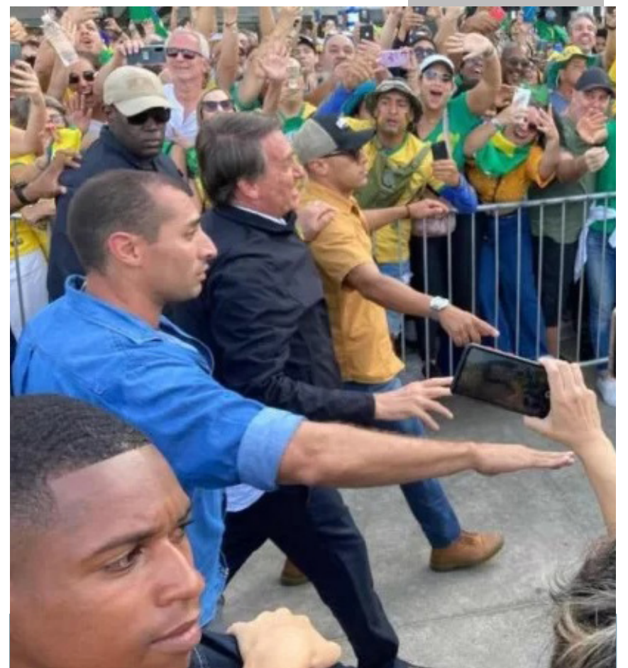
Partido entrou com ação nesta quinta-feira (8/9) pedindo que Bolsonaro e seu vice, Braga Netto, fiquem inelegíveis nessas eleições e por 8 anos

Por meio das redes sociais, Ciro Gomes, candidato pelo PDT à Presidência, definiu como "agressão diplomática" a presença do empresário Luciano Hang, que esteve ao lado do presidente, em vez do presidente de Portugal, Marcelo Rebelo, que está em visita oficial ao país. "Transformar uma solenidade cívico-militar num comício, com milhões de recursos públicos envolvidos. Olha,