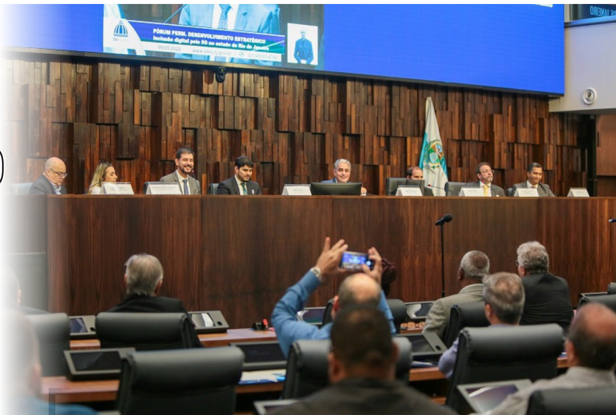
A votação contou a presença, no Plenário, da presidente da Associação dos Familiares das Vítimas de Vigário Geral

A Assembleia Legislativa do Estado do Rio de Janeiro (Alerj) aprovou, em discussão única, na terça-feira, o Projeto de Lei 6.372/22, de autoria do Poder Executivo, que reestabelece a concessão de pensões mensais vitalícias às vítimas das chacinas da Candelária e de Vigário Geral, que aconteceram no ano de 1993, praticamente uma seguida da outra.