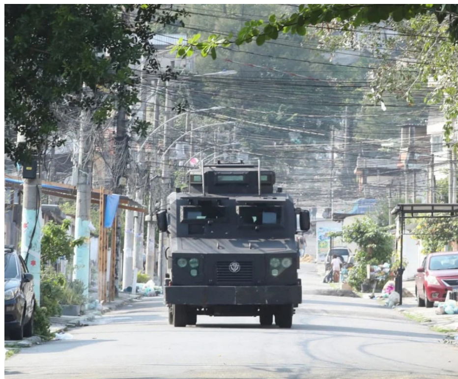
A operação conta com o apoio de veículos blindados e um helicóptero

Em comentários, pessoas também se queixaram da dificuldade de conseguirem sair para trabalhar, devido ao tiroteio. "Tentando chegar no trabalho e passando no meio da bala perdida na Serrinha. Mais um dia tranquilo para o carioca", desabafou uma mulher. "O que o caveirão acha que vai arrumar 6h da manhã na Serrinha, além de me fazer ter que esperar para sair de casa?", questionou outro internauta.