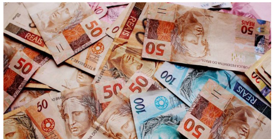
Servidores da Educação de Petrópolis têm direito a reajuste de 9,54%

"Os autos tiveram baixa recente ao Juízo de origem, e o Sepe iniciará o cumprimento de sentença, para que o município seja intimado a cumprir de imediato o que determina a decisão judicial, que abrange todos os profissionais de educação da rede pública municipal", informou o sindicato.