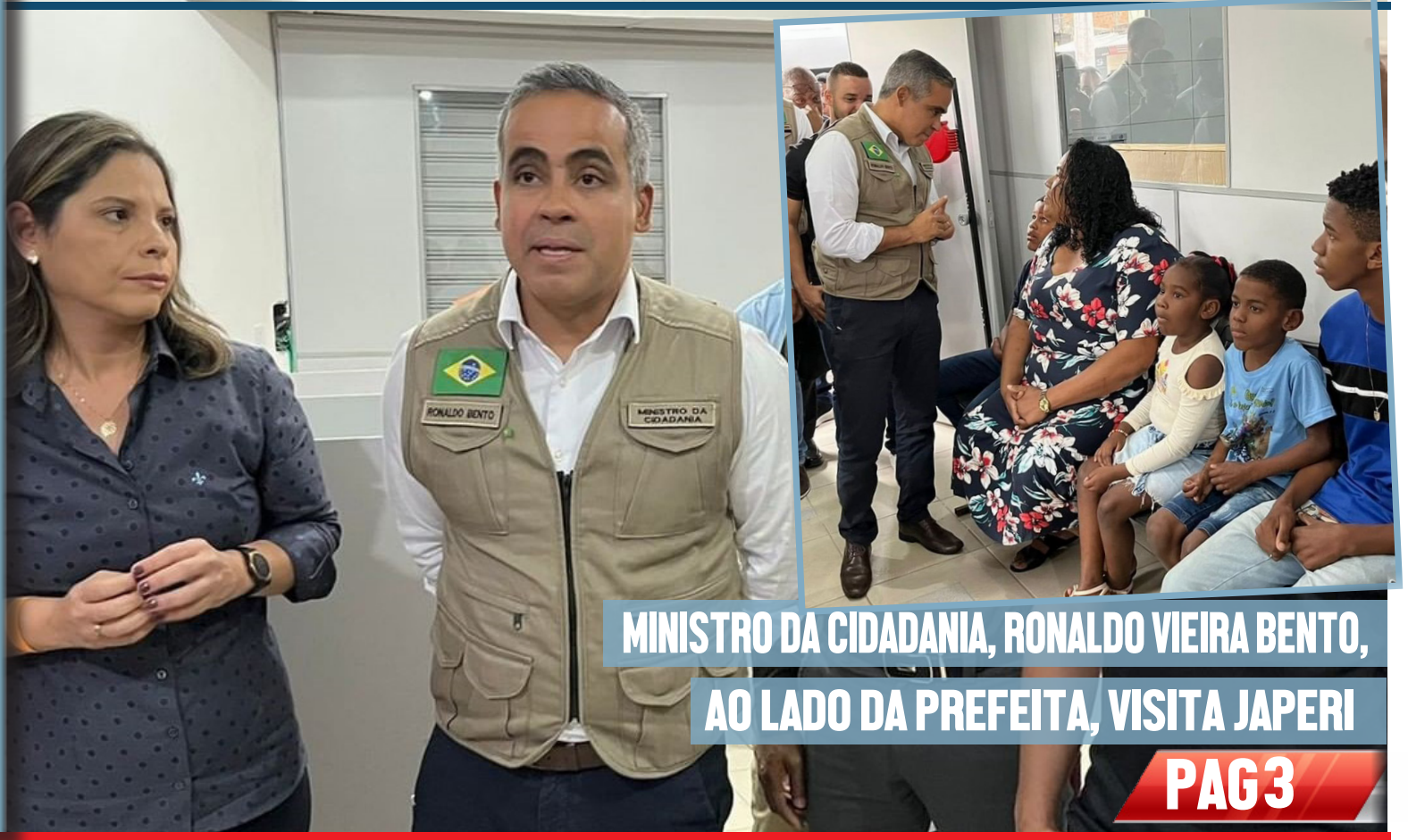
MINISTRO DA CIDADANIA, RONALDO VIEIRA BENTO, AO LADO DA PREFEITA, VISITA JAPERI