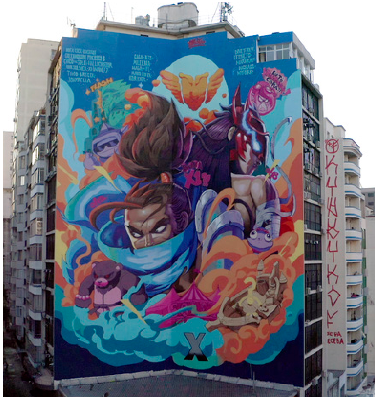
As obras são assinadas por artistas parceiros e homenageiam os personagens mais usados pelos jogadores

“A experiência de pintar este mural foi emocionante. Tanto eu quanto meu irmão (assistente na pintura) so-