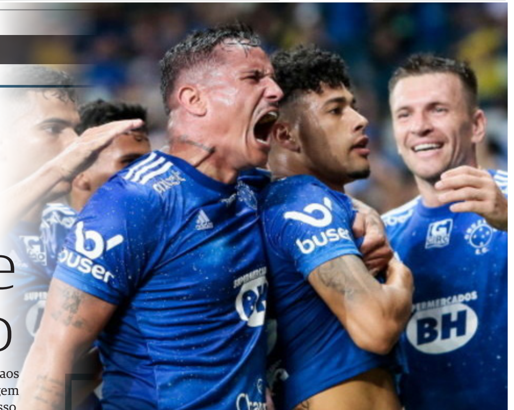
O Cruzeiro chegou aos 68 pontos

O jogo mais esperado da 31ª rodada da competição começou com o Vasco levando perigo aos donos da casa. Mas o tempo foi passando e a Raposa foi assumindo o comando das ações. A equipe comandada pelo técnico uruguaio Paulo Pezzolano abriu o placar aos 24 minutos. Eguinaldo tropeçou na intermediária ao tentar sair jogando e a bola