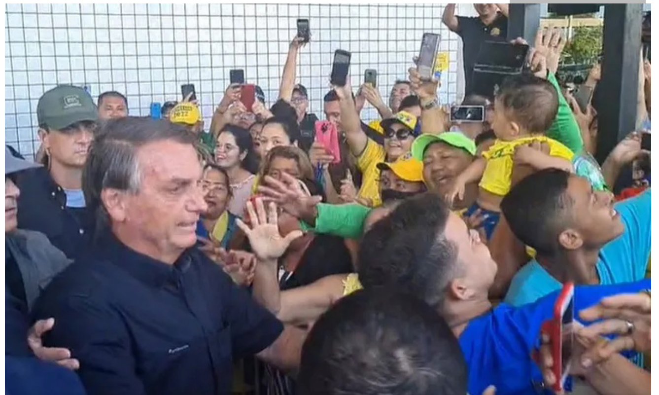
Candidato à reeleição, presidente Jair Bolsonaro (PL) cumprimenta apoiadores no aeroporto de Belém (PA)

Candidato à reeleição, o presidente Jair Bolsonaro (PL) participou de um ato de campanha nesta quinta-feira (22) em Belém (PA) e voltou a criticar o ex-presidente Lula, candidato do PT ao Palácio do Planalto, e reafirmou ser contra o aborto e a legalização das drogas.