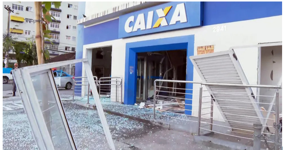
Ação ocorreu na Estrada do Tindiba

O banco Santander confirmou a tentativa de furto na agência da Praça Jauru, nº 23 e afirmou que está colaborando com as investigações policiais. Em nota, a Caixa disse que "coopera integralmente com as investigações dos órgãos competentes e que aguarda libe-