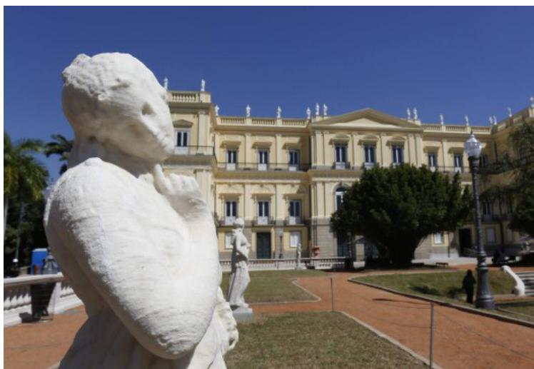
Quatro anos depois do incêndio, Museu Nacional é devolvido para os cariocas

Um Museu Nacional de grandes novidades acaba de ser devolvido ao carioca. Quatro anos depois do incêndio que destruiu o prédio e 85% do acervo de 20 milhões de itens do lugar, a primeira grande etapa de reconstrução do Palácio São Cristóvão foi entregue à população nesta sexta-feira. Abrindo as comemorações para celebrar o Bicentenário da Independência do Brasil, uma programação especial gratuita convida o público a se reconectar com o museu. O evento #Museu-NacionalVive terá exposições, apresentações artísticas e atividades educativas para todas as idades, além de ser uma oportunidade de contemplar a nova fachada principal e o Jardim Terraço, que foi revitalizado.