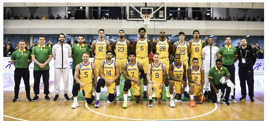
A COMPETIÇÃO VAI SE REALIZAR EM RECIFE E CONTA COM 12 SELEÇÕES