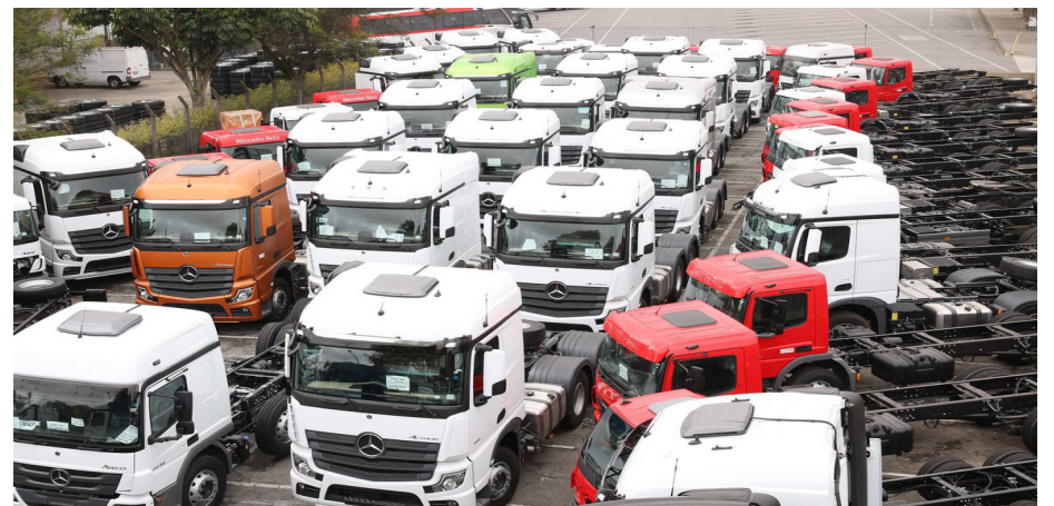
Direção da montadora anunciou 3,6 mil demissões

"Precisamos mostrar que um processo de negociação se faz em torno de uma mesa. Muitas vezes, em um processo de negociação não vai prevalecer tudo que o sindicato quer,