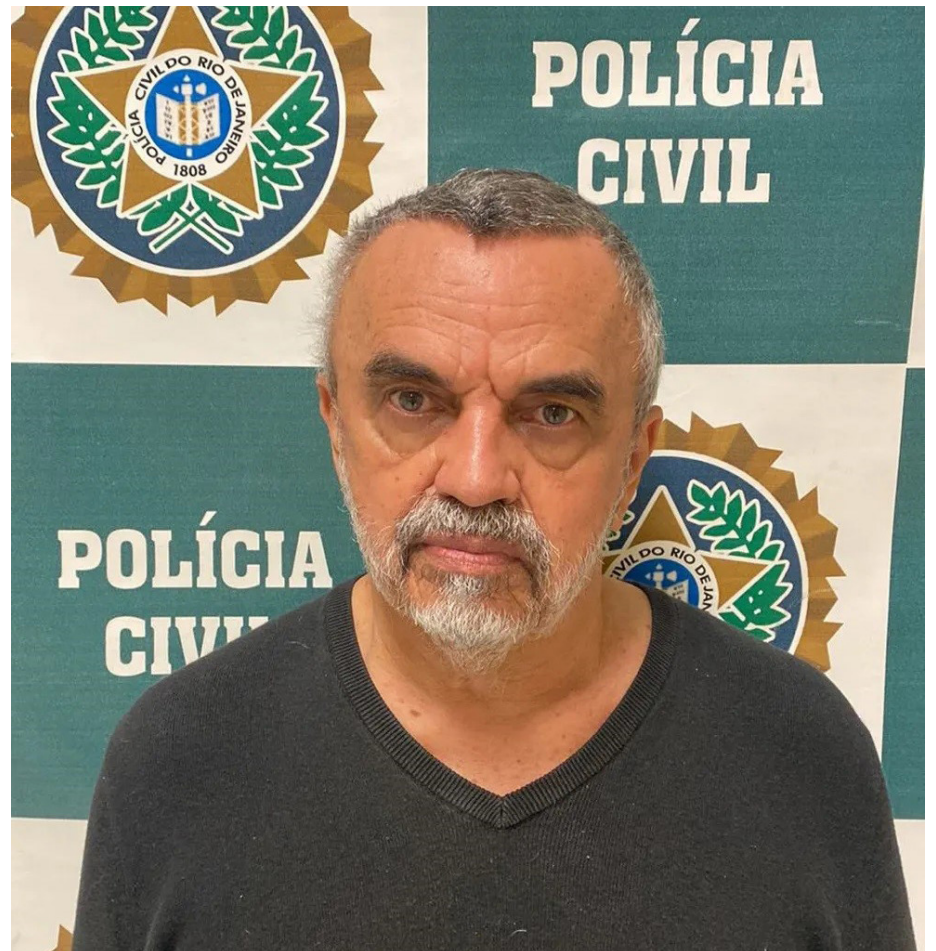
O ator José Dumont foi preso em flagrante pela polícia civil

Dumont já trabalhou na Rede Globo, TV Manchete, Rede Record, entre outros lugares ao longo da carreira.