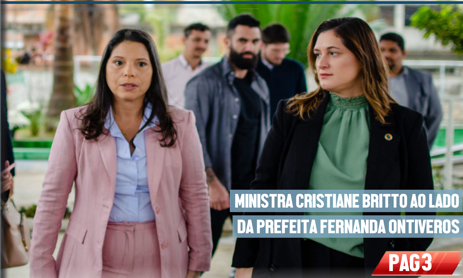
MINISTRA CRISTIANE BRITTO AO LADO DA PREFEITA FERNANDA ONTIVEROS