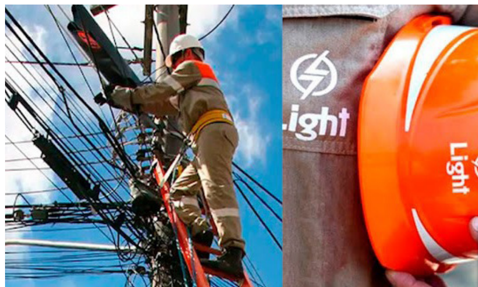
A empresa também disse que a energia poderá ser restabelecida antes do horário previsto

Miguel Couto De 8h30 às 16h Rua Amílcar (parte) Rua Coronel Fawcett (parte) Rua Doutor Borgeth (parte) Travessa Ouveinan (parte) Travessa Vinhatico (parte)