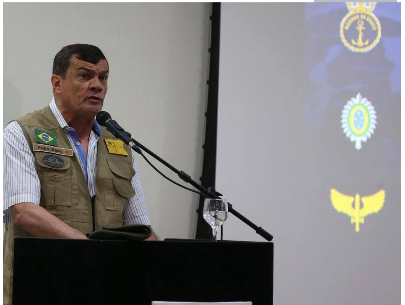
Nota do ministério da Defesa, comandado pelo general Paulo Sérgio, informa sobre envio de documento

O Ministério da Defesa informou nesta segunda-feira (7) que encaminhará, na próxima quarta-feira (9), ao Tribunal Superior Eleitoral (TSE) o relatório técnico sobre a fiscalização do sistema eleitoral brasileiro. A informação vem em meio a atos na frente do quartéis que cobram uma posição dos militares sobre o resultado das eleições. O próprio TSE já