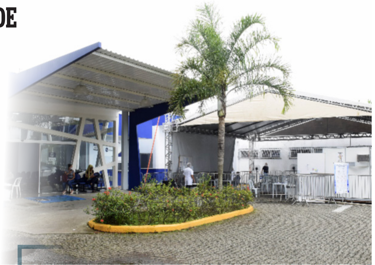
Com as mudanças, unidade passa a se adequar aos parâmetros do Inea

O HME fica na Avenida Marcílio Dias, bairro Jardim Jalisco, número 800. A unidade oferece atendimento de emergência 24 horas, todos os dias e trabalha com uma equipe multidisciplinar de profissionais em regime de plantão, rotina e sobreaviso de especialidades.