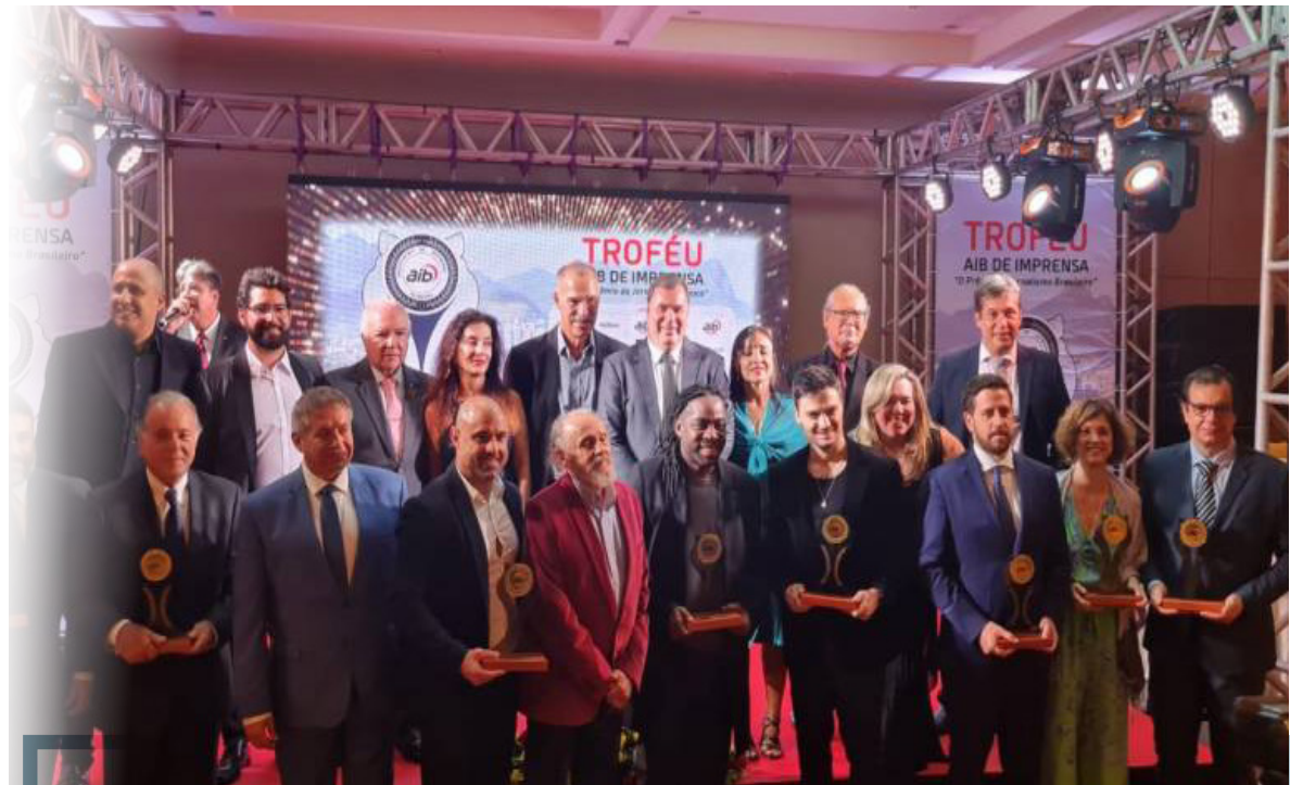
Vencedores do Troféu AIB de Imprensa/2022 no palco do Sheraton com a Diretoria da AIB.