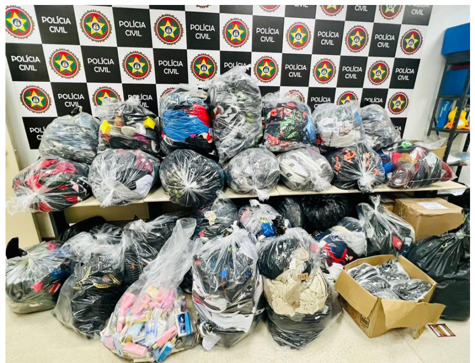
Durante as diligências foram apreendidos diversos produtos com indícios de falsificação

A Delegacia de Repressão aos Crimes Contra a Propriedade Imaterial vem atuando continuamente no combate à pirataria, notadamente em áreas dominadas por grupos paramilitares, não somente