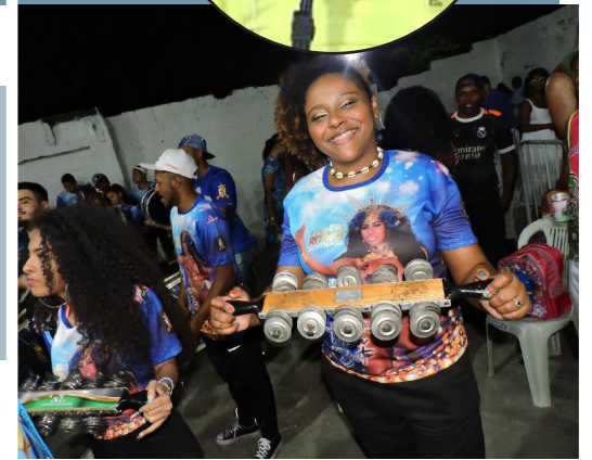
Componentes da escola da Baixada