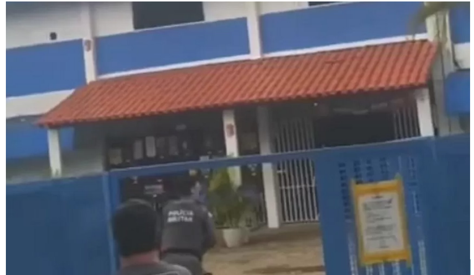
Na primeira escola, dois professores foram mortos e outros nove ficaram feridos

Nas redes sociais, o governador do Espírito Santo, Renato Casagrande, lamentou o atentado e determinou empenho nas investigações. Ele chegou a apontar equivocadamente a segunda instituição como Escola Darwin, que publicou um esclare-