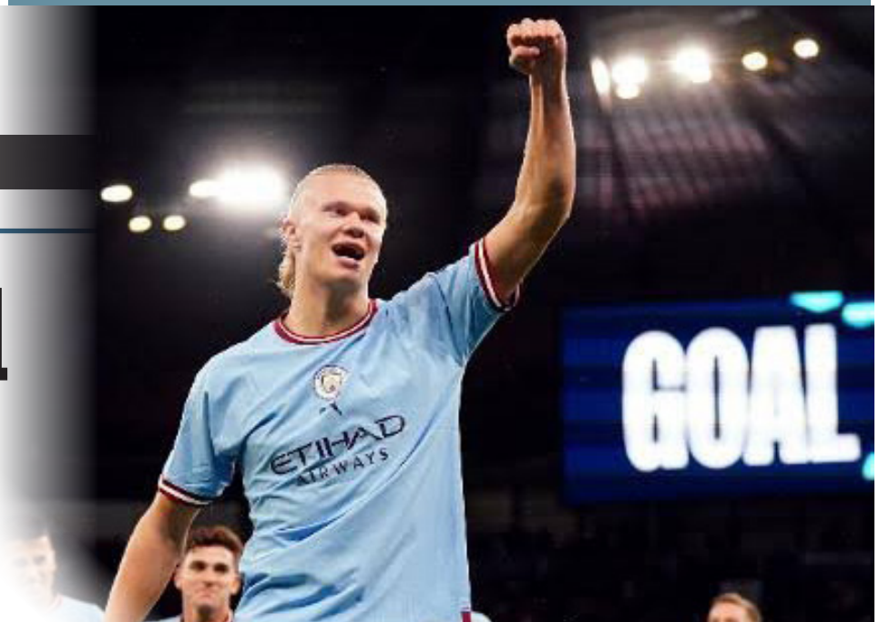
Haaland tem um sistema em casa com vários filtros

A começar pela água da casa do artilheiro do City. Haaland tem um sistema em casa com vários filtros para garantir que a água que bebe é a mais pura possível. O jogador também mantém uma dieta inusitada. Durante as gravações, o norueguês fez questão de mostrar a pró-