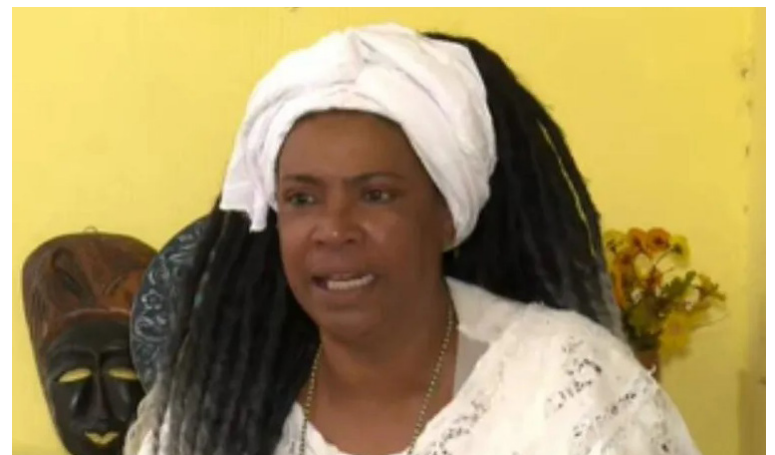
Mãe de santo relata que foi impedida de entrar no Hospital Carlos Chagas