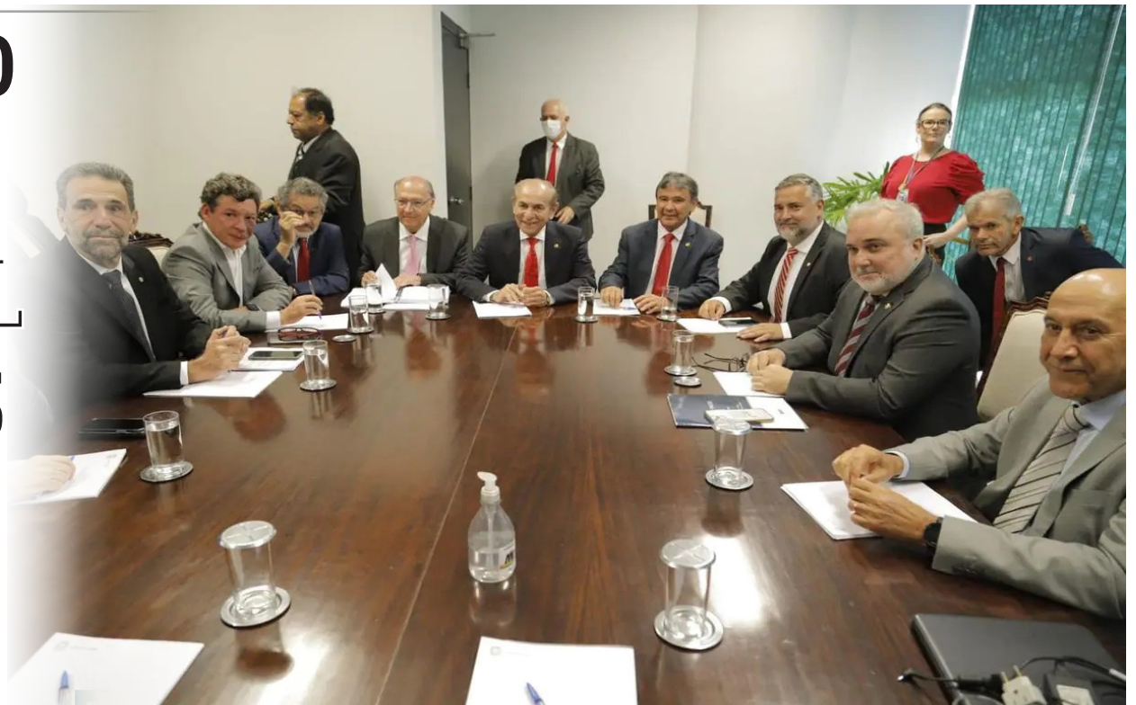
Equipe de transição se reuniu com relator-geral do Orçamento nesta quinta (3)

A lista completa deve ser apresentada na próxi-