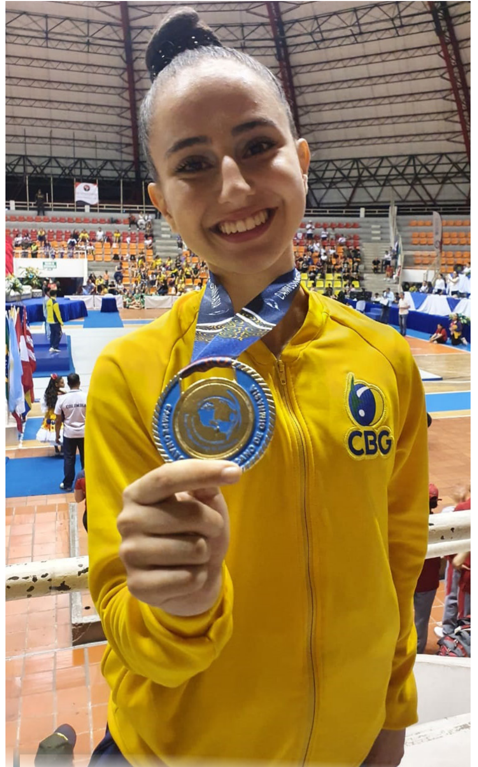
Jovem atleta conquistou o ouro na categoria juvenil, com atletas até 17 anos

“Vou representar o estado do Rio no campeonato que vai acontecer em São Paulo, nos dias 18 e 19 de