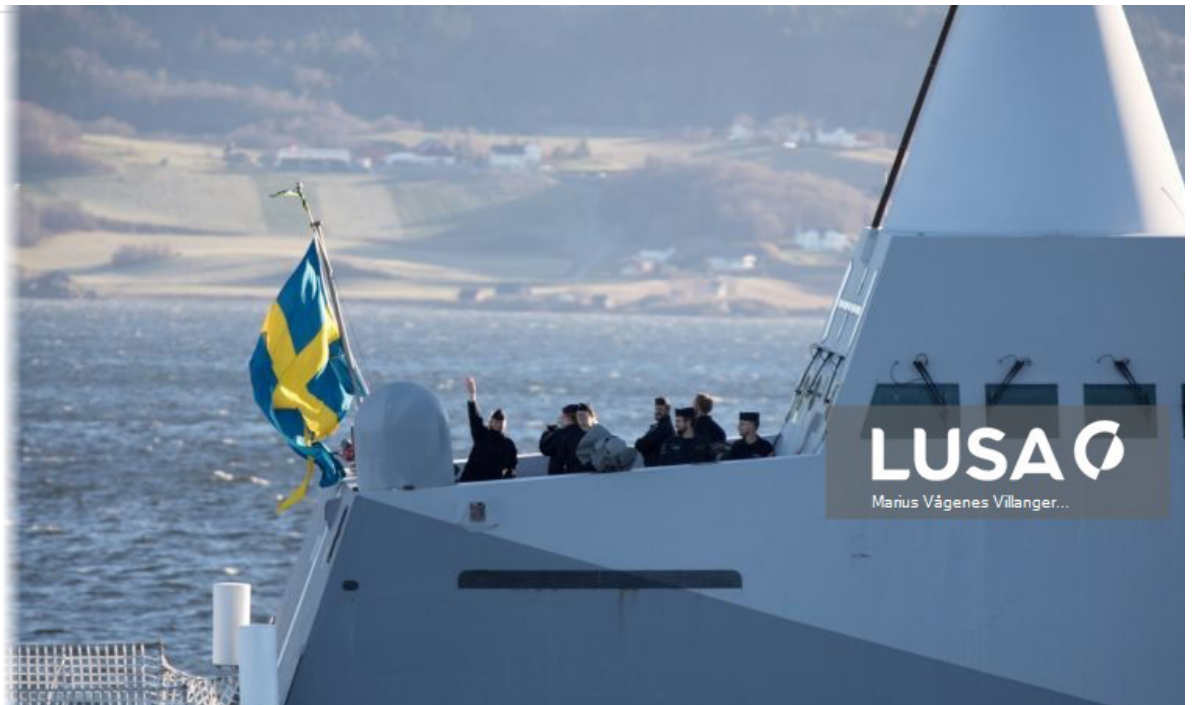
A Noruega é membro da NATO (sigla em inglês da Organização do Tratado do Atlântico Norte)

A Noruega vai elevar o seu nível de alerta militar na terça-feira, devido à guerra na Ucrânia, apesar de não ter detetado uma ameaça direta imediata, anunciou hoje o primeiro-ministro, Jonas Gahr Store. A Noruega é membro da NATO (sigla em inglês da Organização do Tratado do Atlântico Norte) e partilha uma fronteira no Ártico com a Rússia, que invadiu a Ucrânia em 24 de fevereiro deste ano. “A partir de amanhã [terça-feira], a Defesa vai aumentar o seu nível de alerta na Noruega”, disse Store numa conferência de imprensa em Oslo, citado pela agência francesa AFP.