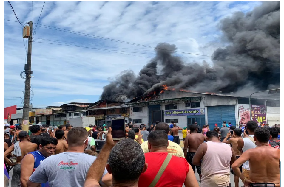
Bombeiros combatem incêndio na Ceasa, no Rio de Janeiro

"Foi tudo muito rápido. Quando começaram a gritar fogo, todo mundo correu.