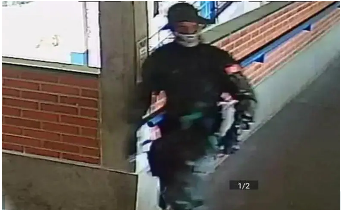
Segundo investigação, atirador usou equipamento de polícia para entrar em escola onde realizou ataque

Conforme o delegado, o menor também relatou ter sofrido bullying no período em que estudou na escola. Os fatos teriam ocorrido em 2019, segundo contou à polícia. "Alguns