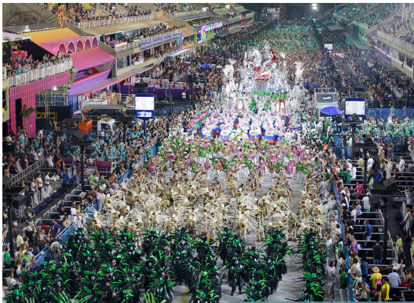
Imagem por Agência Brasil e Texto por Agência Brasil