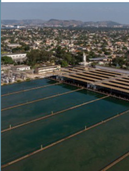
A Águas do Rio informa que conserto em adutora que leva água do Guandu até os municípios da Baixada ainda não tem data para ser finalizado

A Águas do Rio solicita que os usuários façam economia de água, sobretudo durante o reparo da tubulação e o necessário corte no abastecimento.