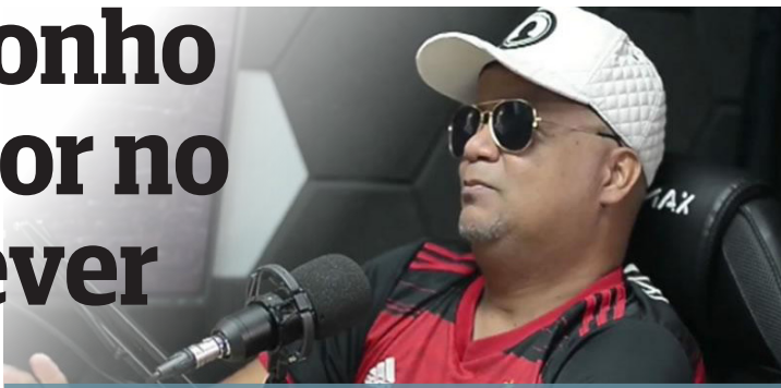
Cantor e compositor conta que quase tiraram refrão do Arlindo Cruz no samba do Império em 2015