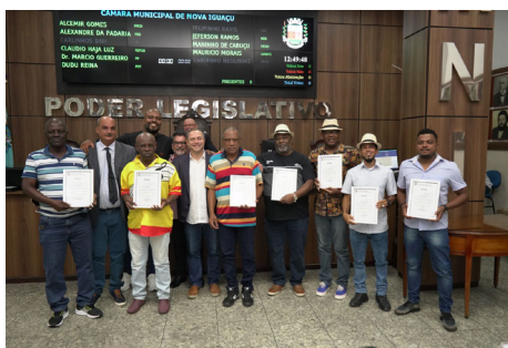
Homenagem aos sambistas de Nova Iguaçu