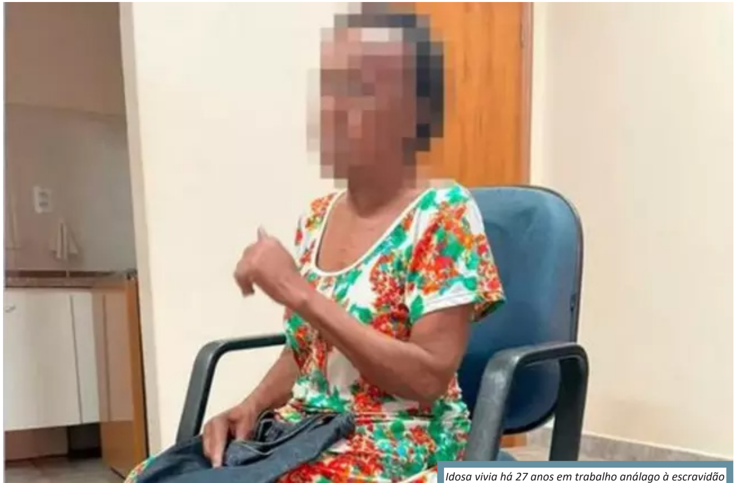
Idosa vivia há 27 anos em trabalho análogo à escravidão

Em diversos momentos da inspeção, a vítima concordava com a cabeça com as informações prestadas pela patroa, entrando