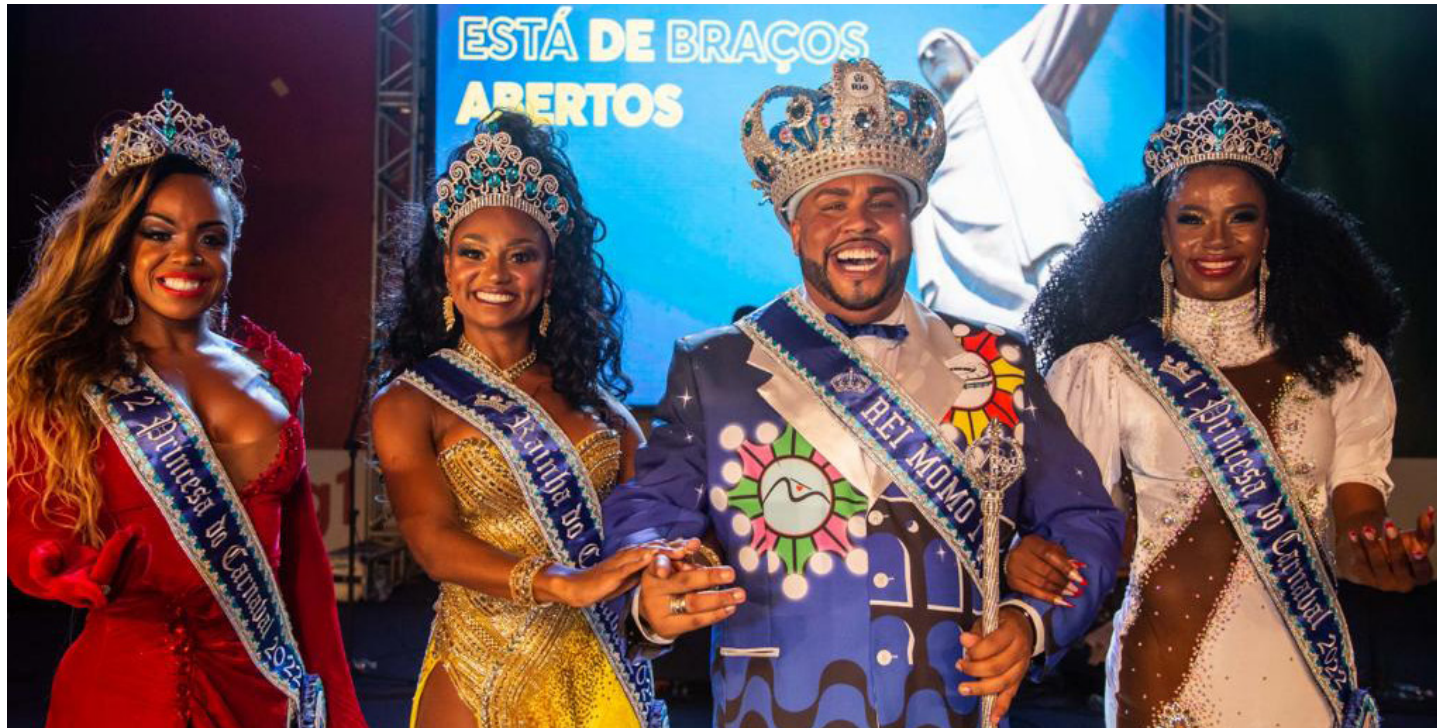
A corte real do carnaval 2022

A Cidade do Samba recebe nesta sexta-feira (9/12), a partir das 18 horas, a semifinal do concurso que vai eleger o Rei Momo, a Rainha e as Princesas do Carnaval 2023. A Comissão Julgadora vai selecionar os finalistas para a grande final que será realizada no dia 16 de dezembro. Organizado pela Prefeitura