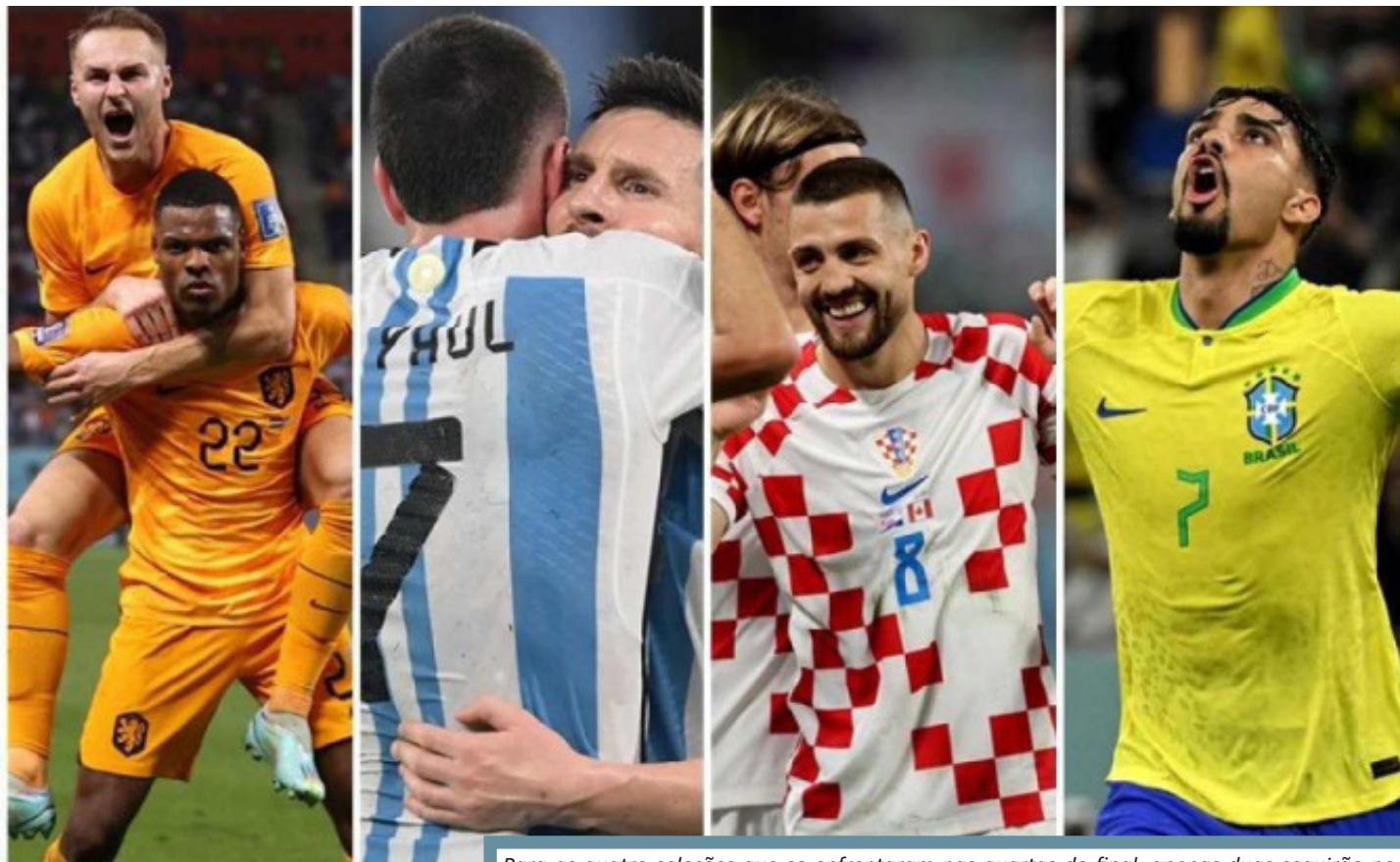
Para as quatro seleções que se enfrentaram nas quartas de final, apenas duas seguirão no sonho da conquista da taça de campeão do mundo

Holanda e Argentina jogam às 16h, no Lusail Stadium. Neste duelo, o protago-