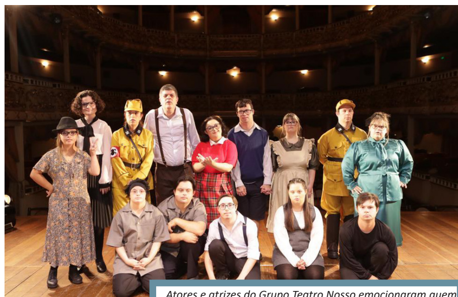
Atores e atrizes do Grupo Teatro Nosso emocionaram quem foi ao Teatro Municipal de São Gonçalo

A pós emocionante apresentação na 2ª Edição do Festival Teatro Nosso, realizado no último fim de semana em Niterói, a peça teatral de "A Menina Que Roubava Livros" estreou em São Gonçalo. Com um elenco formado por atores com deficiência intelectual (autismo e síndrome de down) a apresentação, com entrada grátis para o público, aconteceu dia 7 deste dezembro, quarta-feira, no Teatro Municipal de São Gonçalo - Rua Dr. Feliciano Sodré, 100 (Ao lado da Prefeitura) - Centro, São Gonçalo. Ontem, 8, quinta-feira, o espetáculo foi apresentado exclusivamente para alunos das escolas públicas integrantes do Projeto Escola. As duas apresentações contaram com intérprete de Libras, a Língua Brasileira de Sinais. Essa é a primeira adaptação que o Grupo Teatro Nosso faz de um best seller e, surpreendentemente, com todos os ensaios reali-