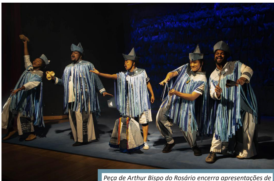
Peça de Arthur Bispo do Rosário encerra apresentações de dezembro nos próximos fins de semana

Após estreia no Sesc Tijuca e exibição na Arena Jovelina Pérola Negra (Pavuna), “Bordador de Mundos” aterrissa na Arena Carioca Fernando Torres, nesta sexta,