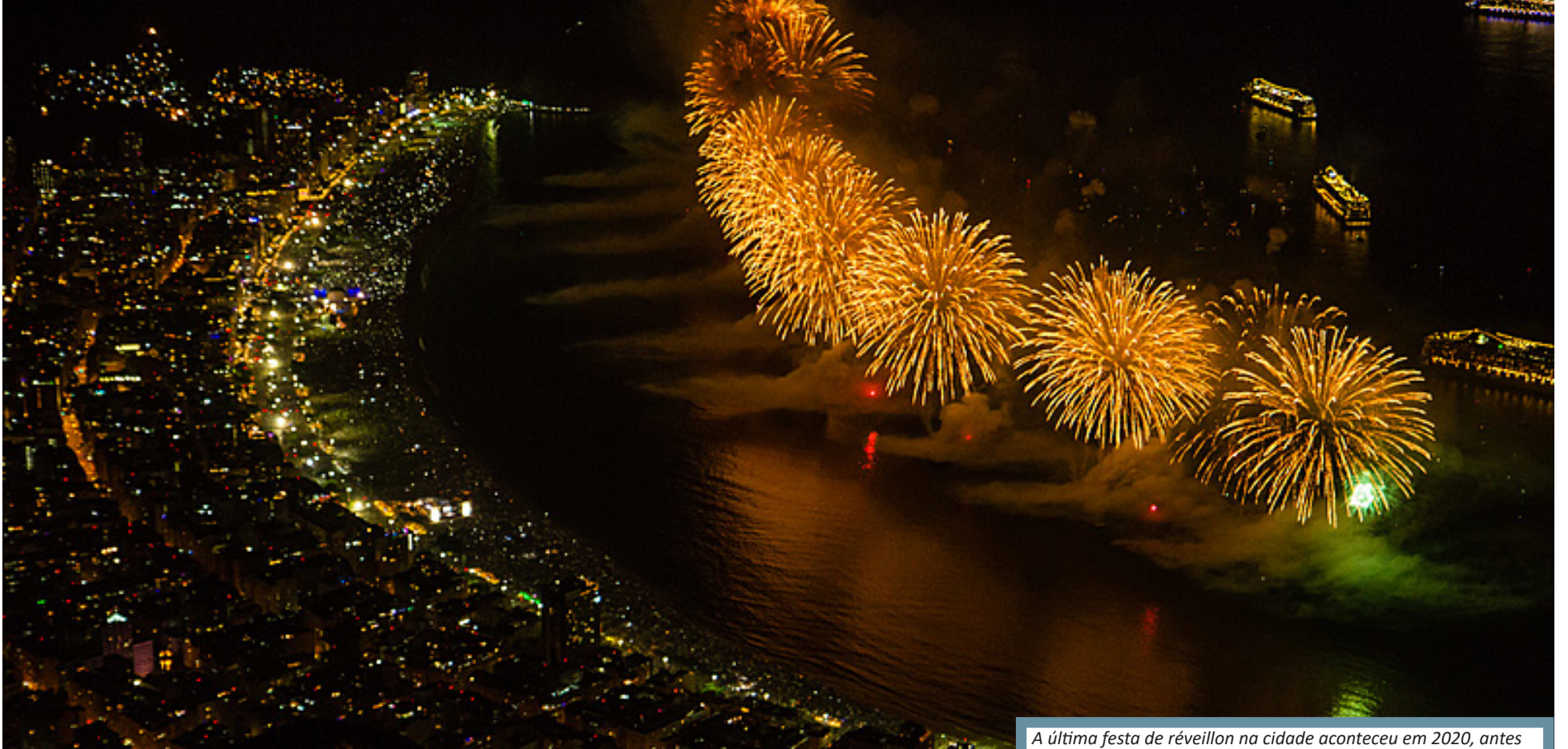
A última festa de réveillon na cidade aconteceu em 2020, antes da pandemia de covid ser confirmada no Brasil

A festa de Réveillon do Rio de Janeiro volta a acontecer neste ano após dois anos suspensa. A atração principal da festa será o cantor Zeca Pagodinho. O anúncio foi feito em uma coletiva de imprensa ontem (14), no Copacabana Palace,