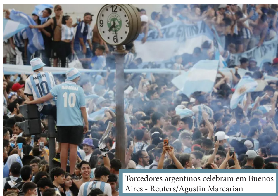
Torcedores argentinos celebram em Buenos Aires

Quem marcou presença na comemoração do elenco foi o ex-atacante Sergio Agüero, vice em 2014. Em outra live, aberta em sua conta oficial, o jogador puxou o coro de músicas em provocação a Mbappé e outros jogadores da França, como Coman e Camavinga. Sobrou até a Inglaterra, rival histórica dos “hermanos”. A festa se estendeu às ruas do Catar. A seleção desfilou em carro aberto no fim da noite deste domingo pela Avenida Lusail, onde foram recebidos por diversos torcedores.