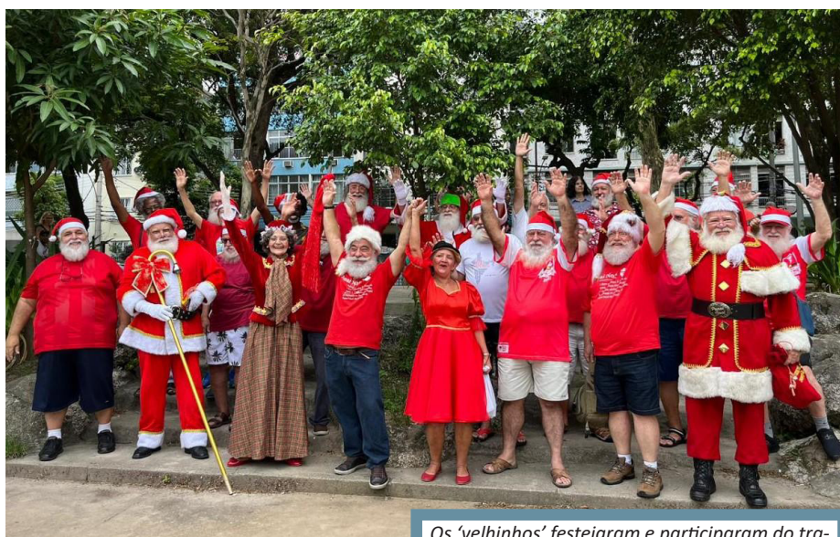
Os ‘velhinhos’ festejaram e participaram do tradicional almoço em um restaurante na Tijuca

Trinta bons velhinhos se reuniram no evento “Barbas de Molho”, confraternização anual no Restaurante Caçador, na Praça Afonso Pena, na Tijuca. O evento começou com abraços e caminhada na Praça Afonso Pena, onde receberam cumprimentos, tiraram fotos com os tran-