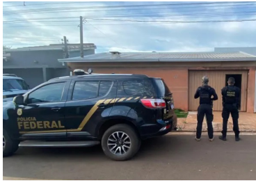
Vianey Bentesda, CNN

PF combate operação de tráfico internacional que utilizava embalagem de agrotóxico