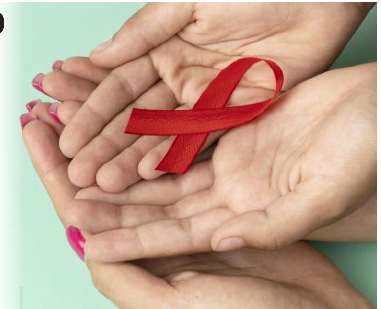
Dia Mundial de Luta contra a Aids - Reprodução

As ações da campanha Dezembro Vermelho são realizadas pela Secretaria Municipal de Saúde e pela Secretaria de Governo e Integridade Pública, por meio da Coordenadoria Executiva da Diversidade Sexual, para lembrar a importância do combate à doença, do investimento em pesquisas científicas e da prevenção ao HIV. É necessário ainda reforçar o enfrentamento ao preconceito existente em relação a pacientes.