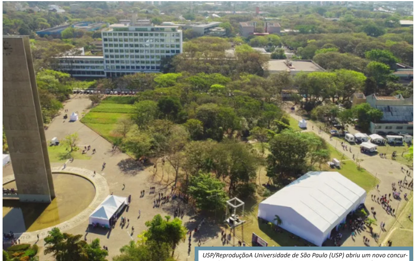
A Universidade de São Paulo (USP) abriu um novo concurso público destinado ao preenchimento de uma vaga de professor doutor.