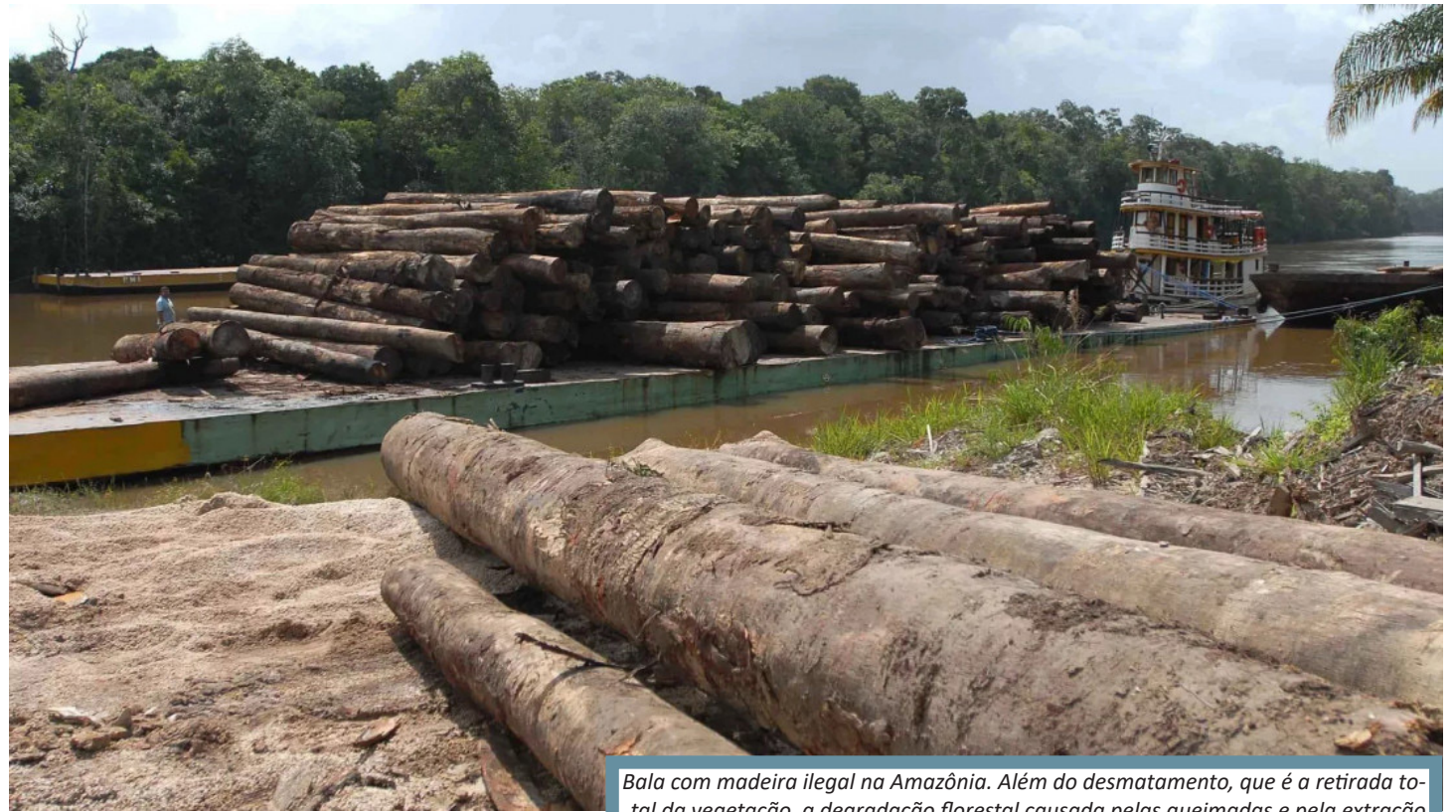
Bala com madeira ilegal na Amazônia. Além do desmatamento, que é a retirada total da vegetação, a degradação florestal causada pelas queimadas e pela extração de madeira aumentou 359%

Ele está congelado desde agosto de 2019, quando o ex-presidente de extrema-direita, Jair Bolsonaro, aboliu