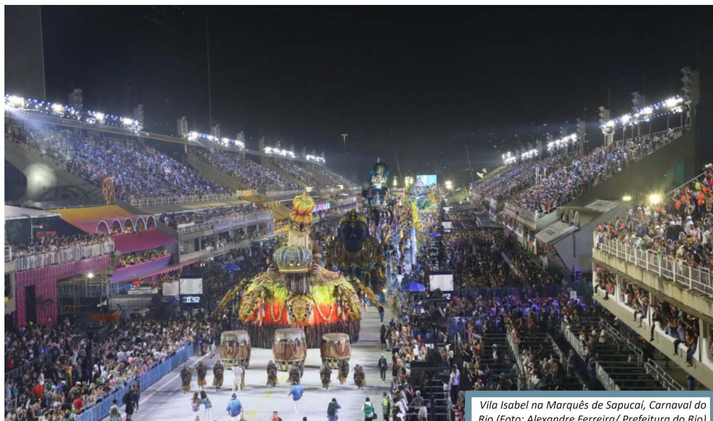
Vila Isabel na Marquês de Sapucaí, Carnaval do Rio

Nessa temporada, as quatro primeiras colocadas em 2022: Grande Rio, Beija-flor, Viradouro e Vila Isabel, vão