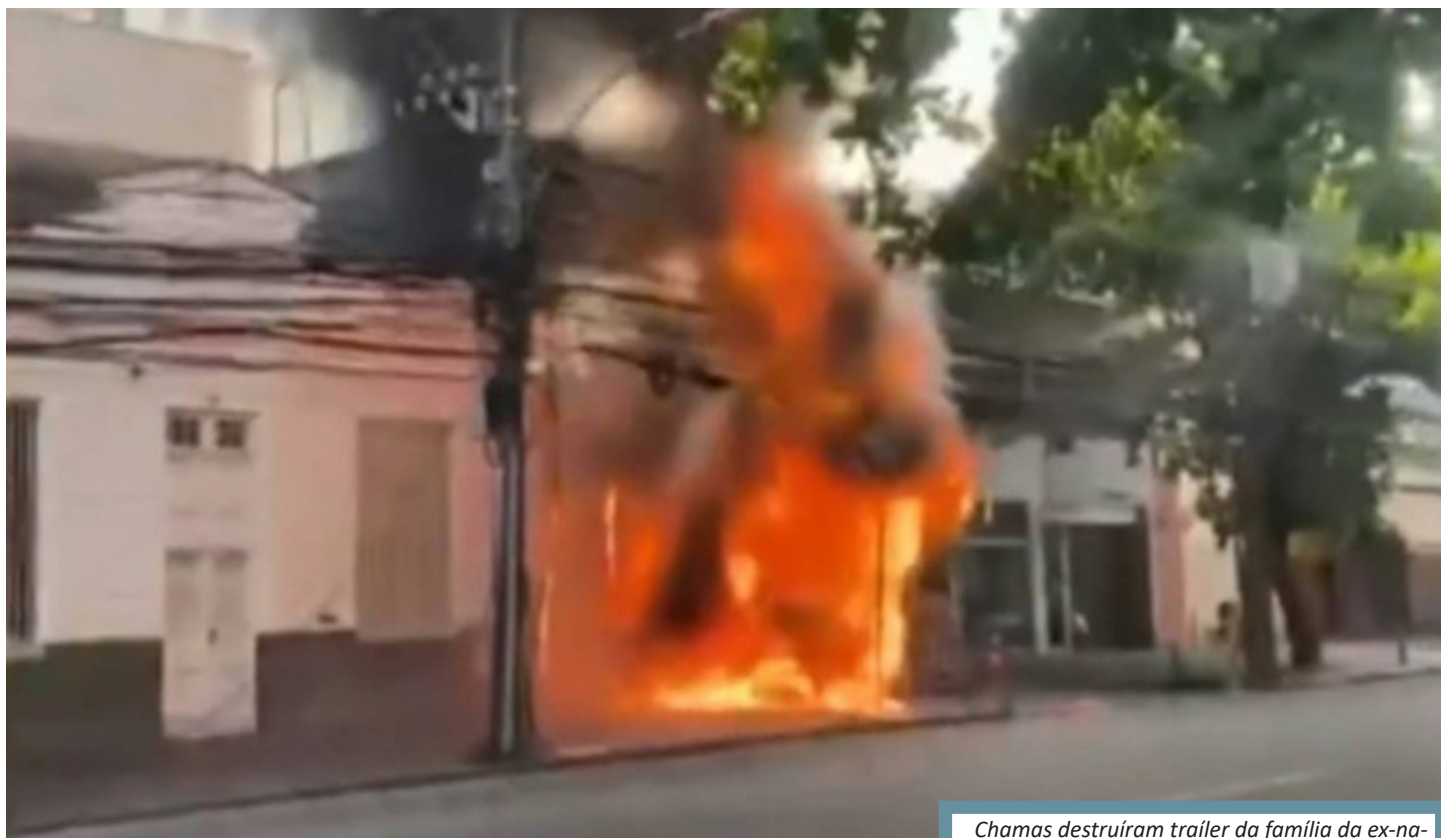
Chamas destruíram trailer da família da ex-namorada do suspeito

O crime teria sido motivado porque ele não aceitava o fim de um relacionamento com a jovem. Ao ser preso, de acordo com o RJTV, Pedro estaria dirigindo embriagado. Segundo o portal G1, no dia do crime, o suspeito teve uma discussão com a ex-namorada, quando teria agredido o ex-sogro. Em seguida, foi até um posto de combustível onde comprou gasolina. Depois, se dirigiu até ao Largo do Pechincha, em Jacarepaguá,