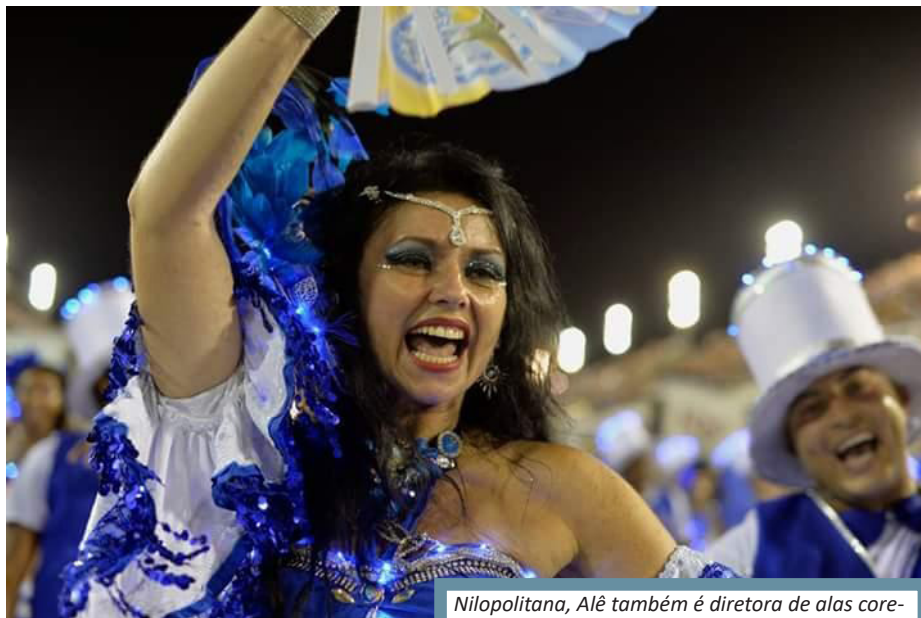
Nilopolitana, Alê também é diretora de alas coreografadas da Beija-Flor e professora de dança

No carnaval é coreógrafa e diretora de ala coreografada na Beija Flor, onde também foi bailarina da Comissão de Frente e professora do projeto Ballet Comunitário, além de estar à frente do quesito na Unidos de Lucas. Foi coreógrafa da comissão de frente da Inocentes de Belford Roxo, Arame de Ricardo, Acadêmicos do Campo do Galvão em Guaratinguetá, Flor da Passagem de Cabo Frio. “Me sinto honrada e feliz com o convite para coreografar a Comissão de Frente da Unidos da Ponte. Com muita garra e emoção pretendo realizar um lindo trabalho nessa amada escola! Muita expectativa e energia positiva nesse maravilhoso enredo!”, revelou a Coreógrafa.