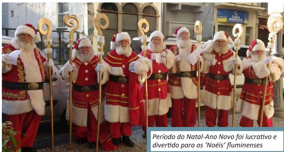
Período do Natal-Ano Novo foi lucrativo e divertido para os 'Noéis' fluminenses

A o contrário dos dois últimos anos, quando a maioria dos Papais Noéis ficaram longe dos tronos de Natal, 2022 trouxe de volta não apenas a magia natalina, mas também uma fonte de renda para cerca de 40 idosos que deram vida ao maior símbolo das festas de final de ano. De acordo com Limachem Cherem, diretor-fundador da Escola de Papai Noel do Brasil, houve uma procura de 40% para a contratação dos alunos Noéis. A chegada dos Papais Noéis nos shoppings do Rio de Janeiro, começou no dia 5 de novembro e até o último dia 25 de dezembro, ainda estavam trabalhando em visitas e entregas de presentes. A profissão temporária, ajudou os 'bons velhinhos', garantirem renda extra que variou entre R$ 7 mil e R$ 15 mil reais, incluindo as festas de fim de ano. Depois de muito trabalho, os Papais