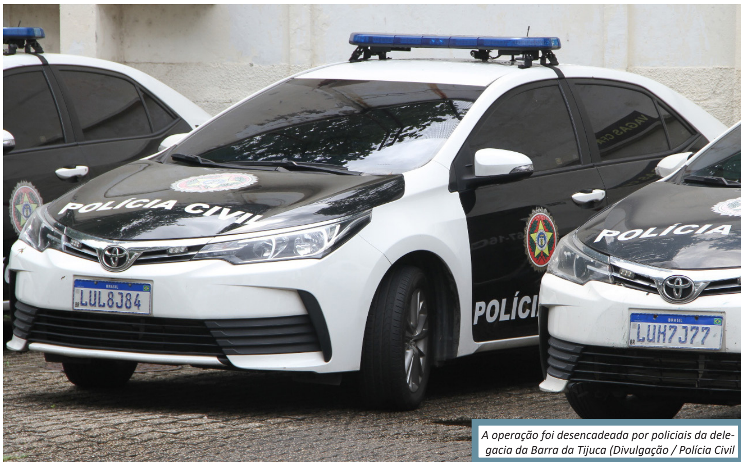
A operação foi desencadeada por policiais da delegacia da Barra da Tijuca

foram até a casa de um comparsa e, após o renderem, levaram também sua mãe, seu padrasto e um primo para a comunidade de Rio das Pedras, Zona Oeste da