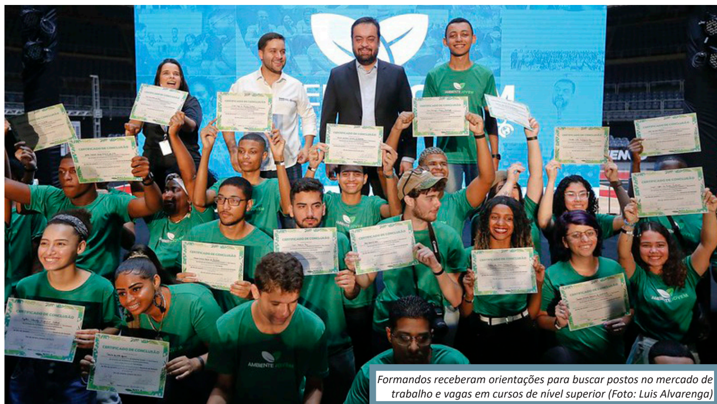
Formandos receberam orientações para buscar postos no mercado de trabalho e vagas em cursos de nível superior

- Estamos muito satisfeitos com estas primeiras 40 turmas que estão concluindo o programa. Temos certeza que formamos