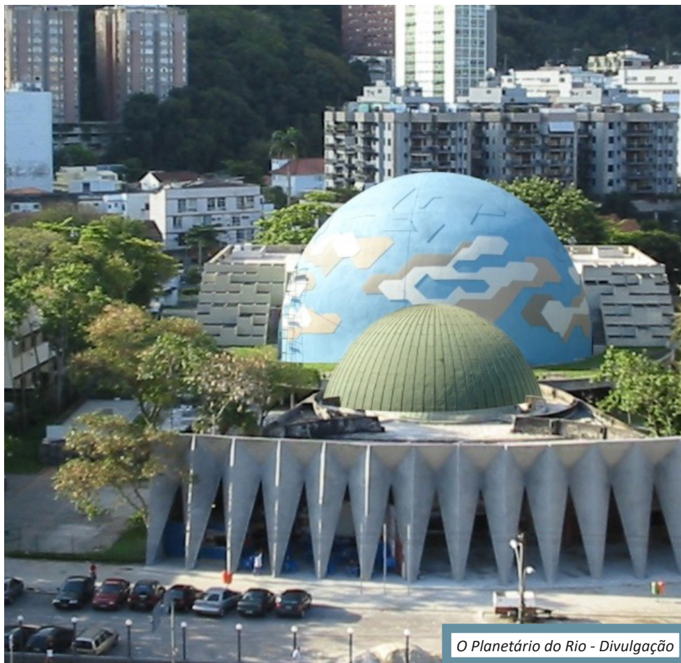
O Planetário do Rio

Durante todas as atividades, a visita ao museu ocorre simultaneamente.