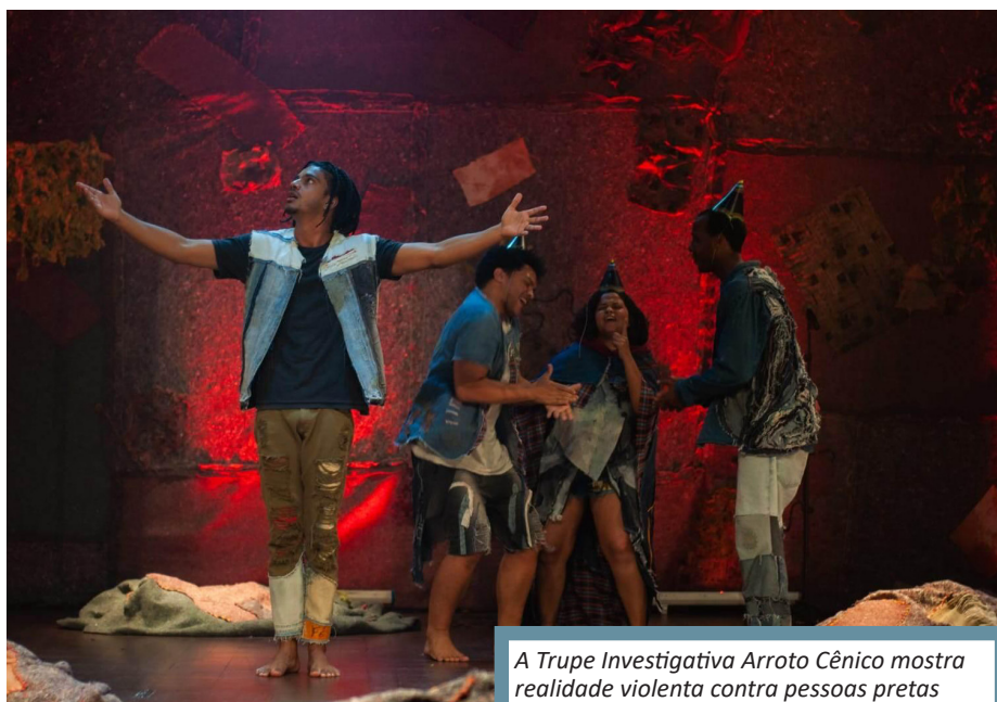
A Trupe Investigativa Arrote Cênico mostra realidade violenta contra pessoas pretas