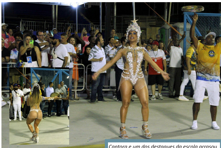
Cantora e um dos destaques da escola arrasou na avenida e atraiu olhares durante o desfile