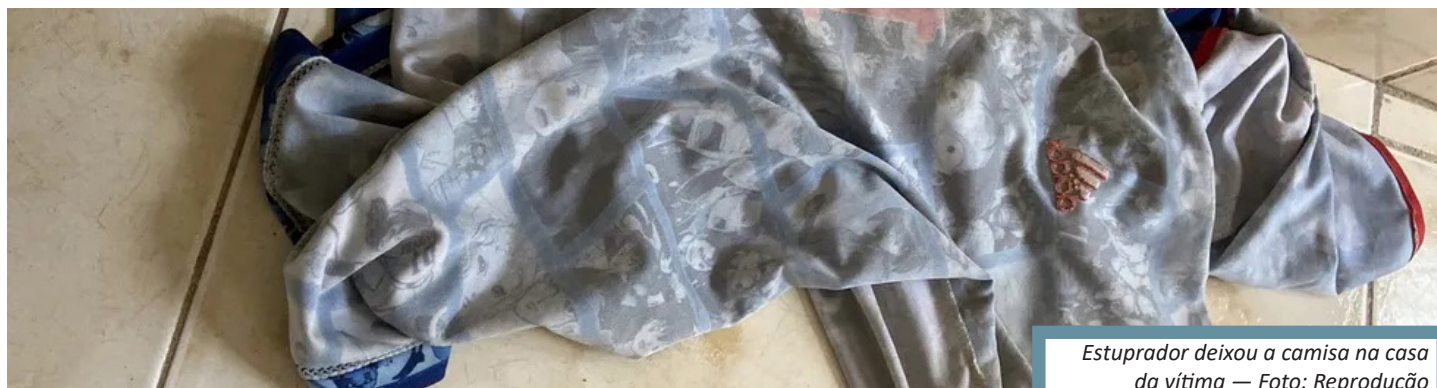
Estuprador deixou a camisa na casa da vítima

De acordo com a especializada, diligências estão em andamento para localizar o autor.