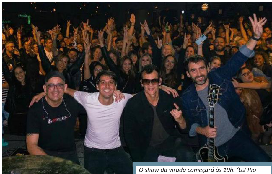
O show da virada começará às 19h. 'U2 Rio Tribute Band' subirá ao palco às 10 da noite

O Bar das Artes receberá o público para o réveillon com show ao vivo a partir das 19h, com a U2 Rio Tribute Band subindo ao palco às 22h e estendendo sua apresentação até às 2h do primeiro dia de 2023. O Bar das Artes fica na Rua Aires Saldanha, 13, em Co-