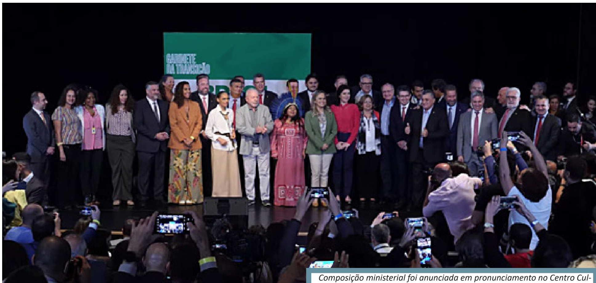
Composição ministerial foi anunciada em pronunciamento no Centro Cultural Banco do Brasil (CCBB), em Brasília (DF)

Presidente eleito comparou escolhas com convocação de Tite para a Seleção Brasileira na Copa do Mundo do Catar