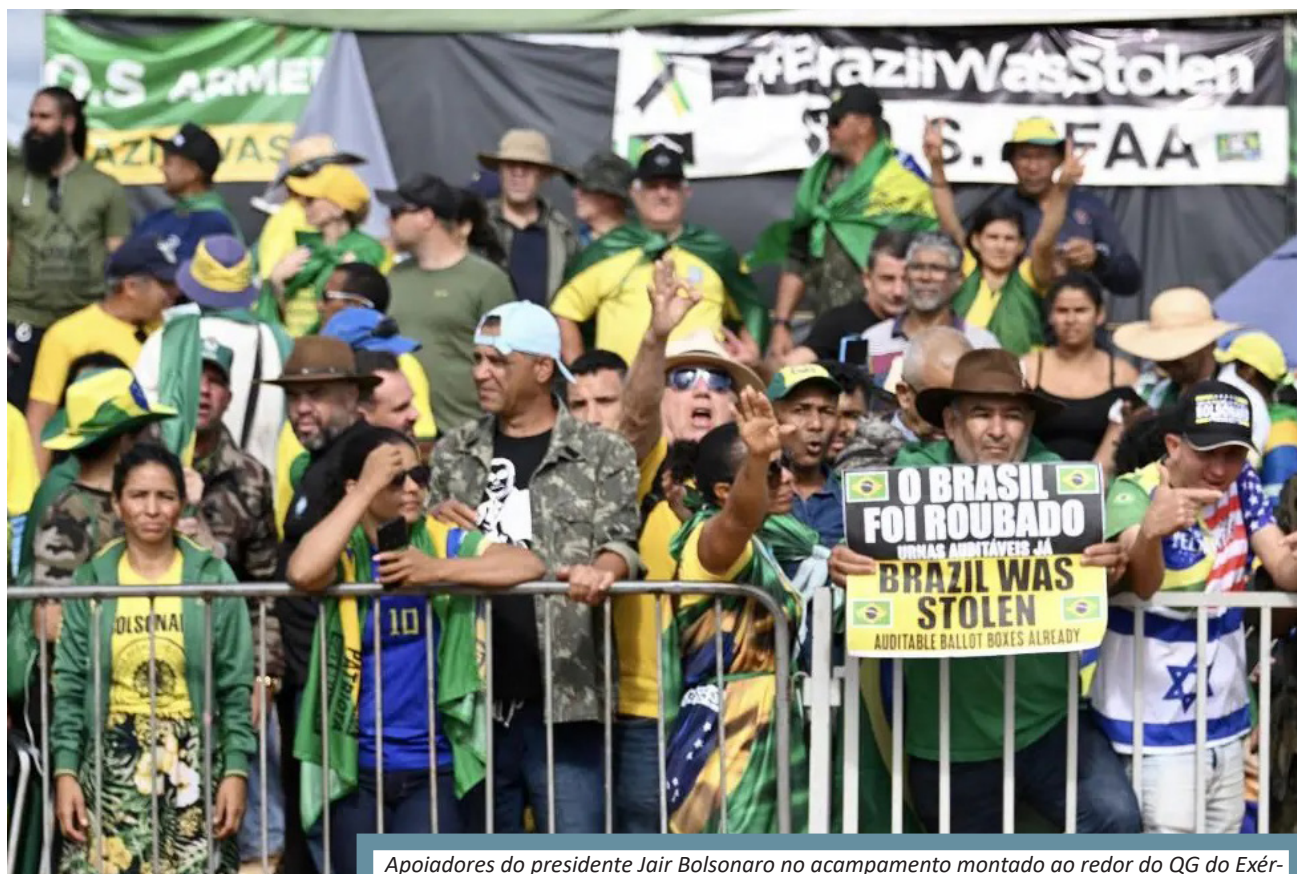
Apoiadores do presidente Jair Bolsonaro no acampamento montado ao redor do QG do Exército, em Brasília, pedem intervenção militar contra a posse de Lula