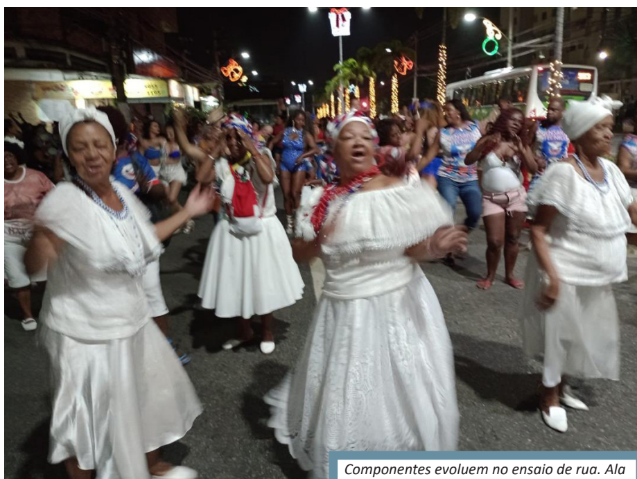
Componentes evoluem no ensaio de rua. Ala das Baianas puxam a evolução da escola

Ainda estão abertas as inscrições gratuitas para quem deseja desfilar na agremiação,