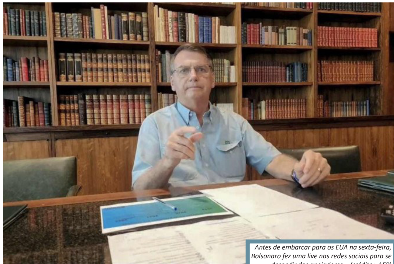
Antes de embarcar para os EUA na sexta-feira, Bolsonaro fez uma live nas redes sociais para se despedir dos apoiadores

"Bolsonaro cometeu crimes em série durante seu governo. Chamá-lo de genocida não é exagero. Infelizmente as instituições não agiram a tempo e tivemos de esperar até as eleições", escreveu o presidente do PSol, Juliano Medeiros, em uma postagem no Twitter