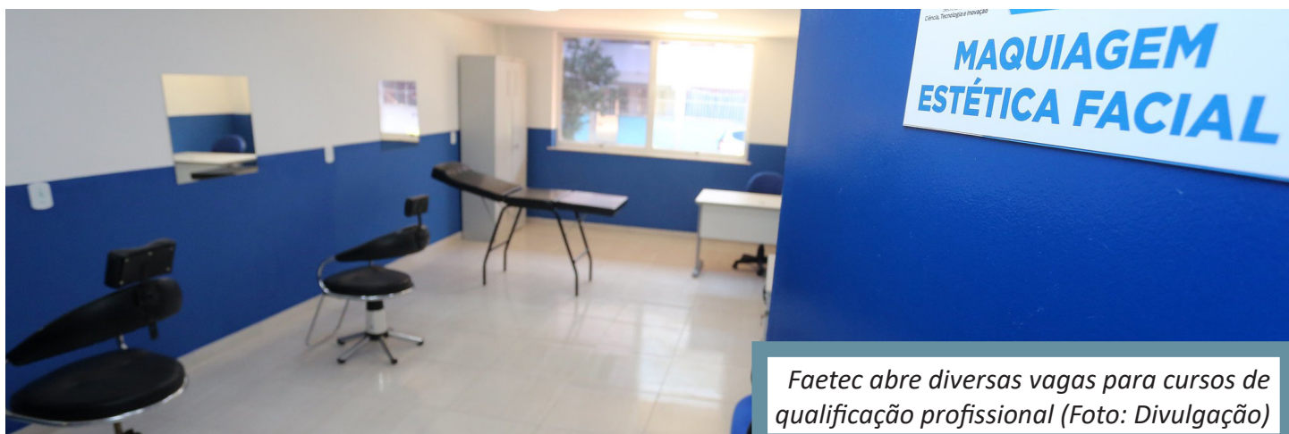
Faetec abre diversas vagas para cursos de qualificação profissional

Entre os cursos presenciais, destacam-se: Assistente Administrativo; Operador de computador; Inglês; Excel avançado com VBA; Cabeleireiro; Espanhol básico; Manicure e Pedicure; Massagista; Eletricista Instalador Predial de Baixa Tensão e Montador e Reparador de Computadores. O