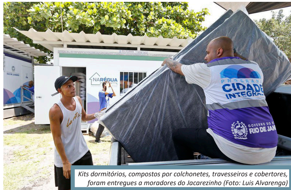
Kits dormitórios, compostos por colchonetes, travesseiros e cobertores, foram entregues a moradores do Jacarezinho

- A equipe do Cidade Integrada foi na minha