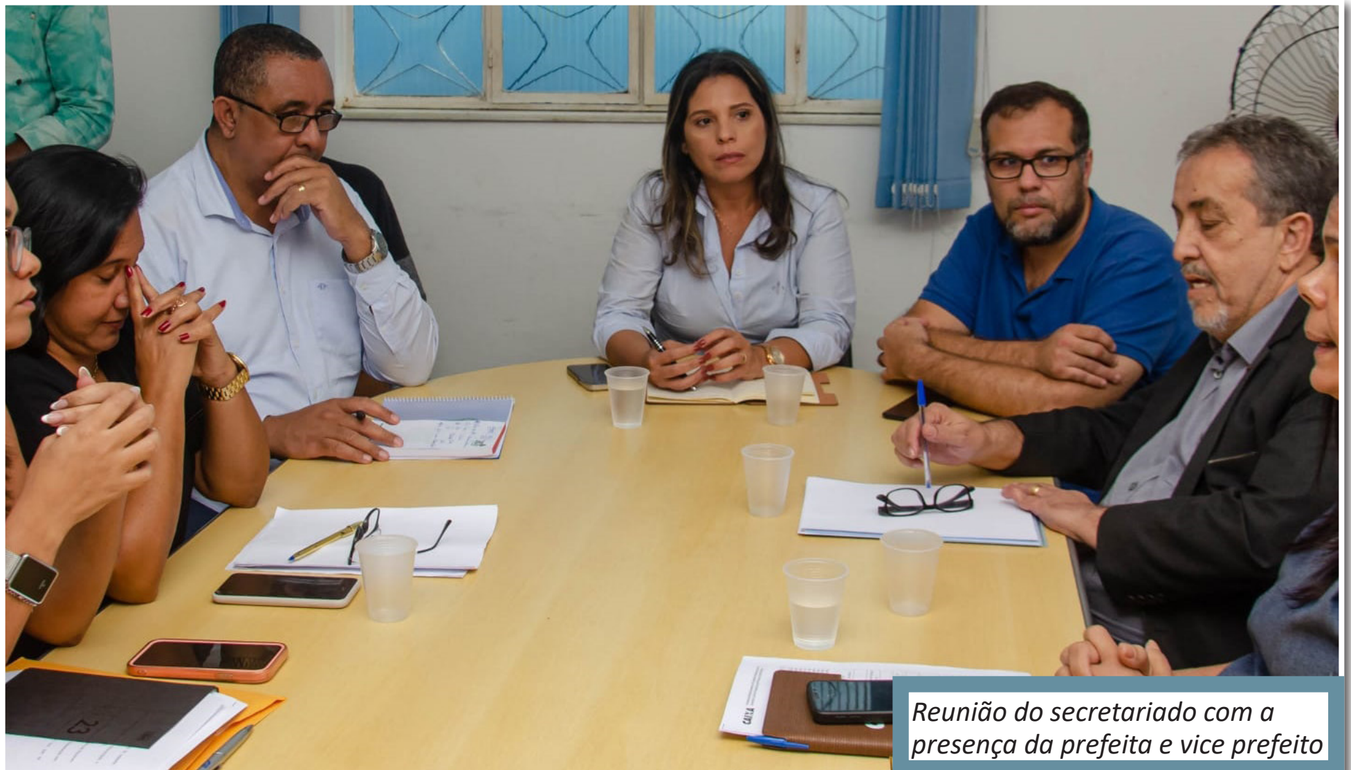
Reunião do secretariado com a presença da prefeita e vice prefeito

Para finalizar o vice prefeito deu sinais de que vai incentivar a prefeita a disputar uma reeleição “Apesar de todo trabalho, sabemos que quatro anos é pouco para implementar tudo que a cidade precisa. Apesar de não ser o momento, disse a prefeita que estarei ao seu lado nestes dois anos que restam de mandato e na busca de uma reeleição” concluiu