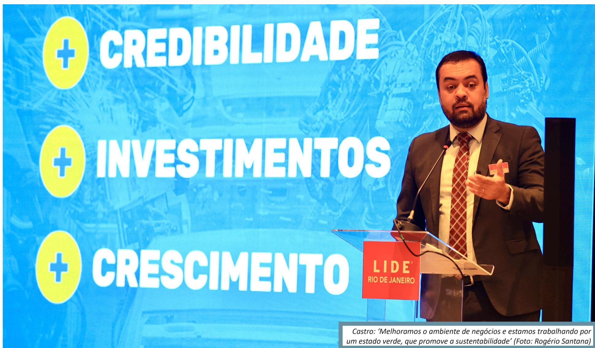
Castro: 'Melhoramos o ambiente de negócios e estamos trabalhando por um estado verde, que promove a sustentabilidade'

Governador anunciou a empresários a criação de Plano Estadual de Reindustrialização para gerar emprego e renda e fez projeção para os próximos quatro anos